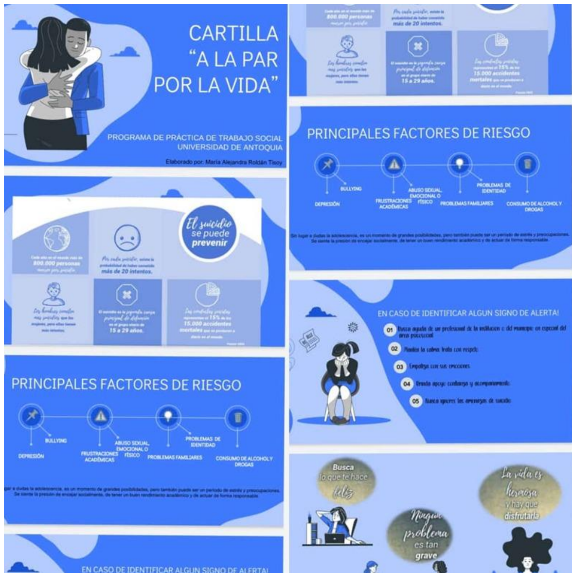
Figura 12 Cartilla a la par por la vida