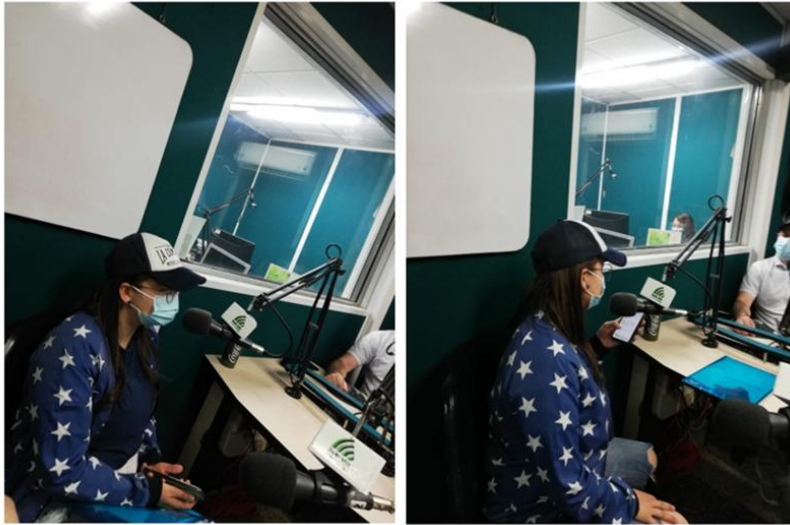
Evidencia fotográfica participación programa radial