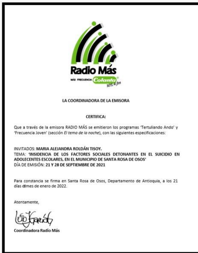
Certificado de participación programa radial