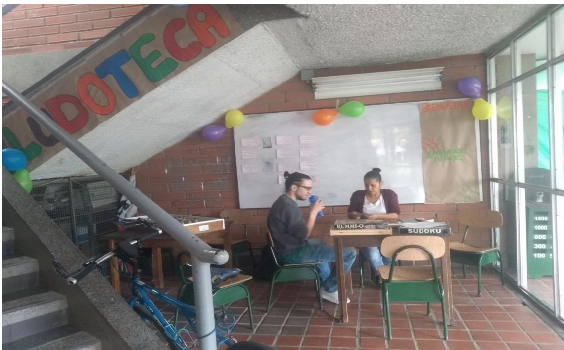
Ilustración 10: Ludoteca Escuela de Idiomas