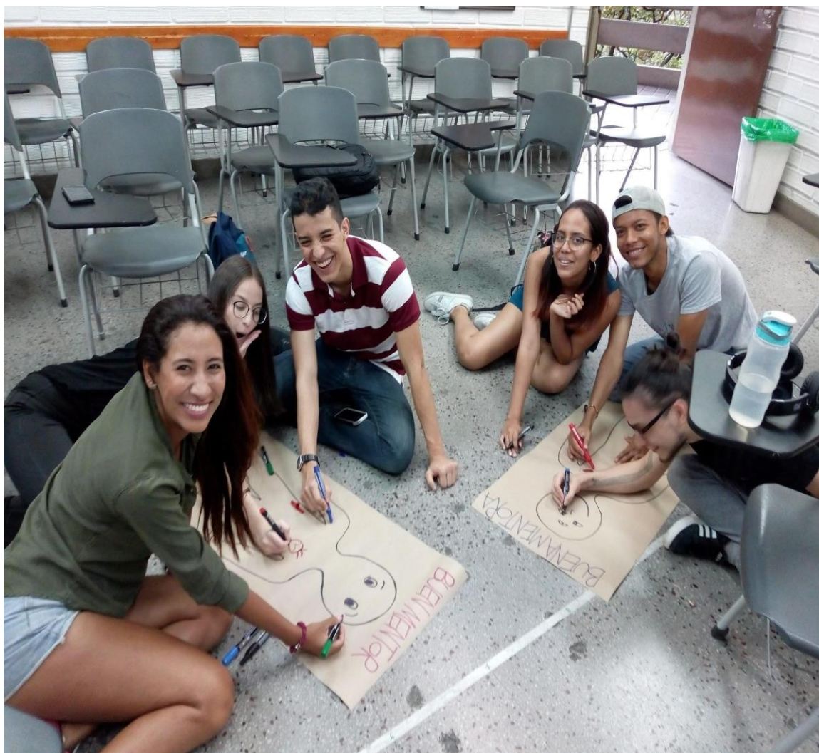
Ilustración 5: taller "ser mentor"