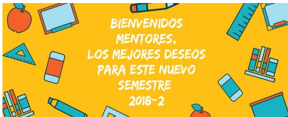
Ilustración 1 Saludo de bienvenida a los Mentores

El diseño de estrategias y promoción de actividades se relaciona con todos los mecanismos que se han usado para convocar a los estudiantes para distintas actividades realizadas por parte de Bienestar, encuentros, talleres, ludoteca, promoción del programa Mentores y Tutores, entre otros. Por medio del diseño de plantillas. Diseños agradables que generaran interés por las actividades que se iban a realizar, las plantillas diseñadas fueron difundidas por medio de correos electrónicos, y muchas de ellas como las invitaciones para la ludoteca se publicaban en la planta física del bloque.