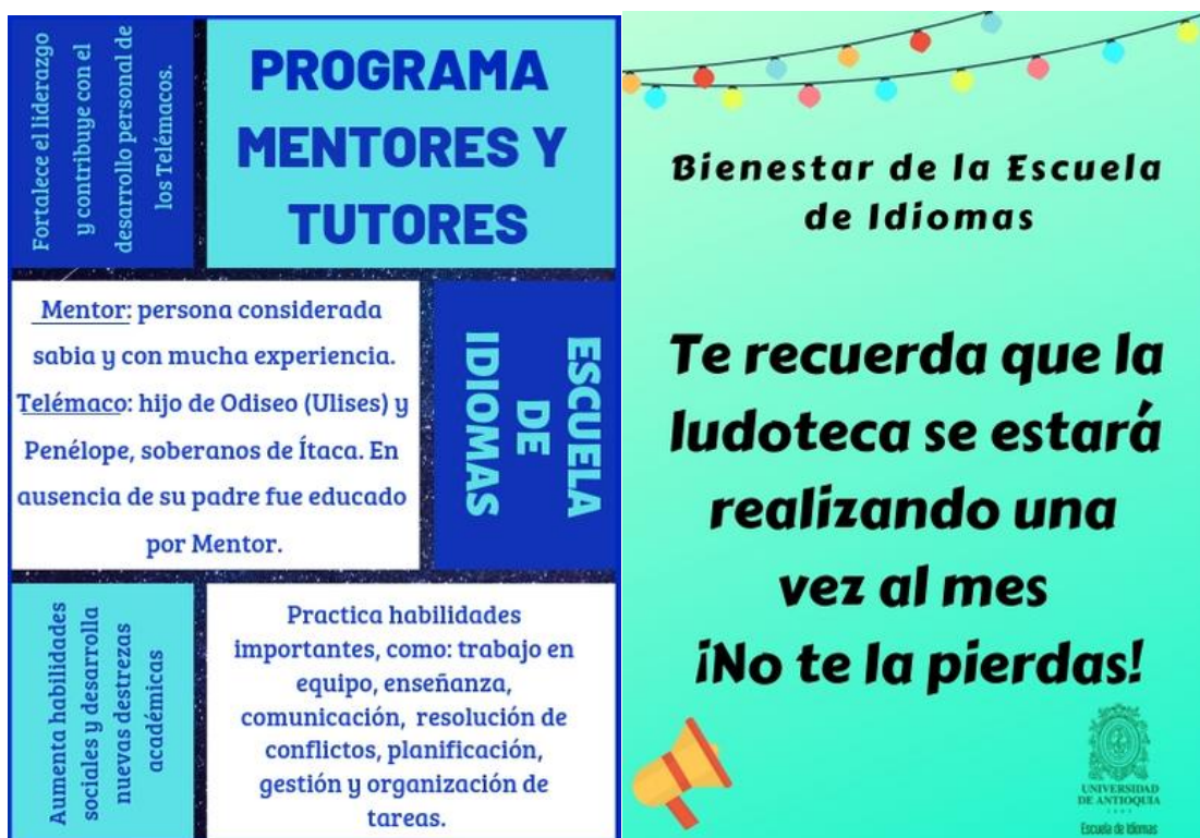
Ilustración 7: invitaciones realizadas para las jornadas de Bienestarea