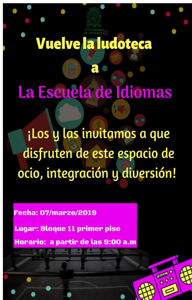
Ilustración 9: invitación a la ludoteca