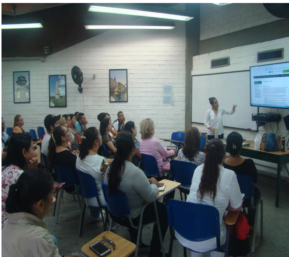
Ilustración 8: reunión con padres de familia en la jornada de inducciones

En el proceso se realizó un acompañamiento continuo a los estudiantes, desde la orientación, la asesoría y la presentación de algunos puntos, tales como dar a conocer el programa de Mentores y Tutores, y la presentación y bienvenida a los padres de familia, en el cual se les contó sobre aspectos puntuales relacionados con las funciones de Bienestar, y todos los servicios y programas que se ofrecen para sus hijos, también se resolvieron inquietudes planteadas por los padres, con relación a la matrícula, horarios, liquidación, ayudas económicas, entre otras dudas concernientes a la vida en la universidad.