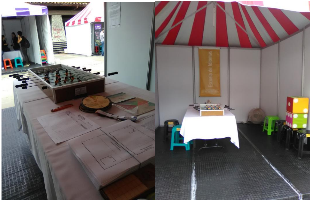
Ilustración 6: Stand Bienestarea

stand de la Escuela de Idiomas se enfocó en dar a conocer el programa y los distintos servicios ofrecidos por parte de Bienestar central, todo se hizo por medio de juegos, de acertijos, sopa de letras, ahorcado y futbolito, juego de dados gigantes y preguntas.