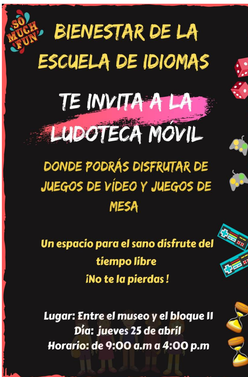
Ilustración 2: Invitación a la ludoteca móvil