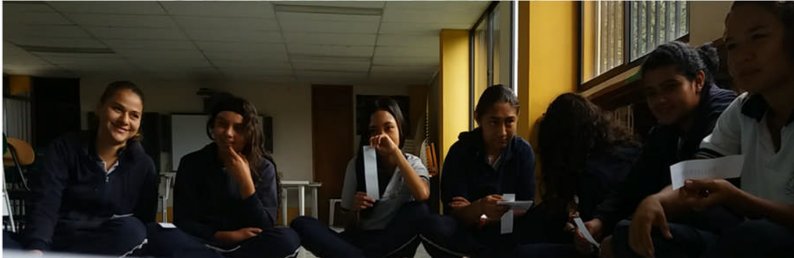
Imagen 2. Actividad permanente de lectura en voz alta con el grado octavo de la Institución Educativa Rural La Carbonera.

fueron producciones de estudiantes de diferentes regiones del país; lo cual era una motivación para que, en el grado octavo construyeran sus propios relatos, desde sus vivencias y, con posibilidades de publicación.