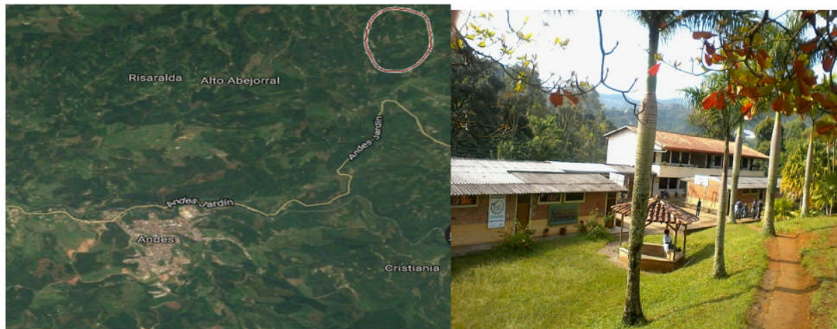
Imagen 1. El Corregimiento San Bartolo y la Institución Educativa Rural La Carbonera donde se realizó la investigación

Para llegar al corregimiento, desde el caso urbano, se hace necesario transitar por extensas carreteras bordeadas con verdes cultivos de café y plátano, que le dan a la región, no solo el más bello paisaje, sino también el sustento diario para cada una de las familias que comparten el territorio.