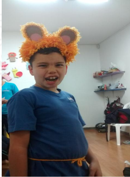
Figura 1: Representación Teatral