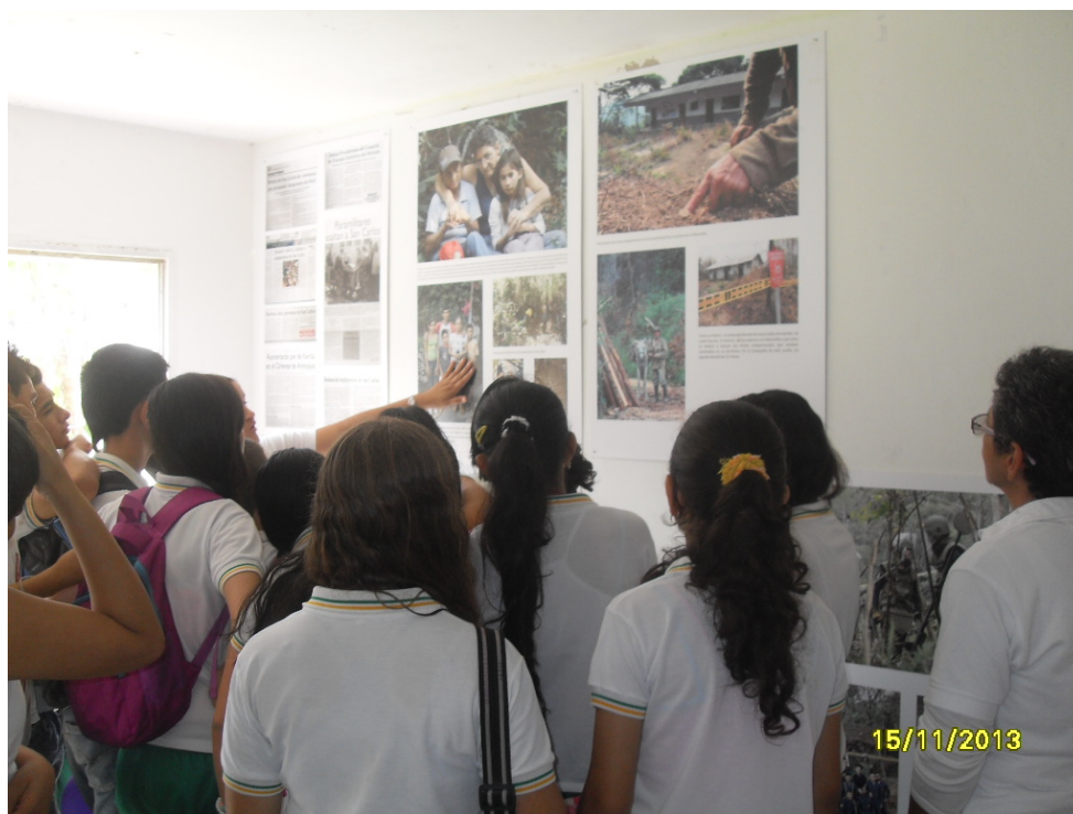
Figura 10. Fotografía recorridos pedagogización de la memoria.

Esta experiencia hizo parte de la selección, ya que se consideró que constituye una estrategia valiosa, que buscó vincular a las instituciones educativas del municipio, al trabajo realizado por el CARE en relación a la construcción de memoria.