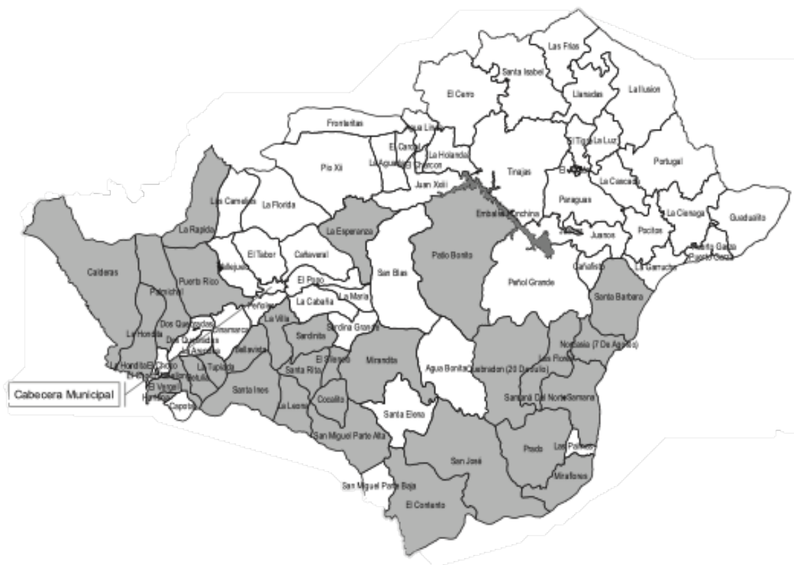
Figura 2. Mapa de veredas abandonadas por desplazamiento forzado en San Carlos.

Para el caso de San Carlos, municipio que como se ha señalado anteriormente fue afectado en tales proporciones por el conflicto social armado, siendo uno de los hechos victimizantes de más resonancia el desplazamiento forzado, el cual lo hizo ocupar uno de los lugares con mayor número de personas desplazadas en el marco del conflicto social armado colombiano, el retorno ha recibido una atención especial a diferencia de otros casos de retorno en el país, donde se han realizado intervenciones de diferentes instituciones gubernamentales y no gubernamentales con el objetivo de apoyar estos procesos.