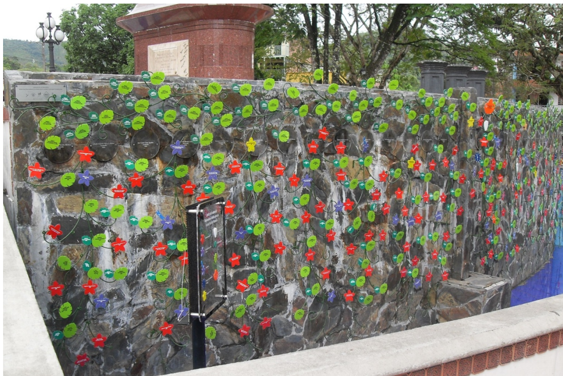
Figura 9 Fotografía Jardín de la Memoria.