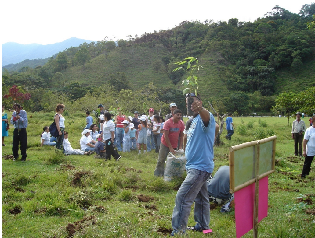
Figura 5. Fotografía jornada "Siembra una planta, cultiva una vida".