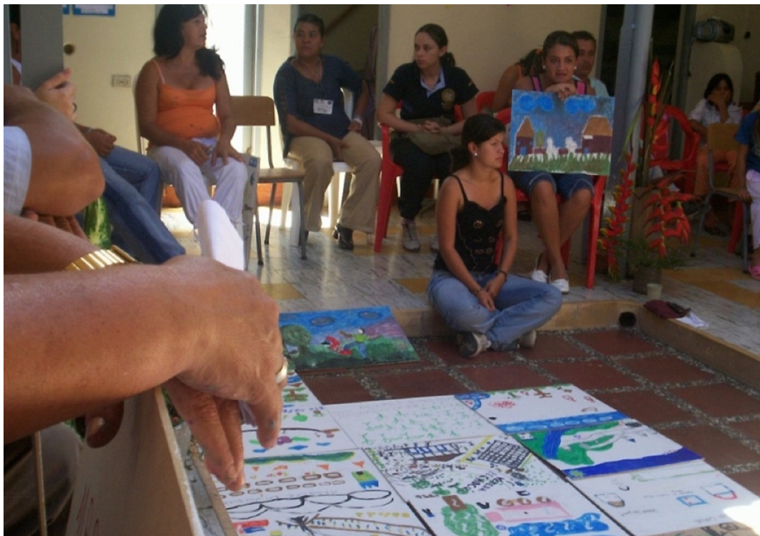
Figura 6. Fotografía talleres "Pintando memoria".

específicamente la memoria de forma particular, y que además, ha sido un valioso insumo para los ejercicios de divulgación de memoria que se realizan en el CARE.