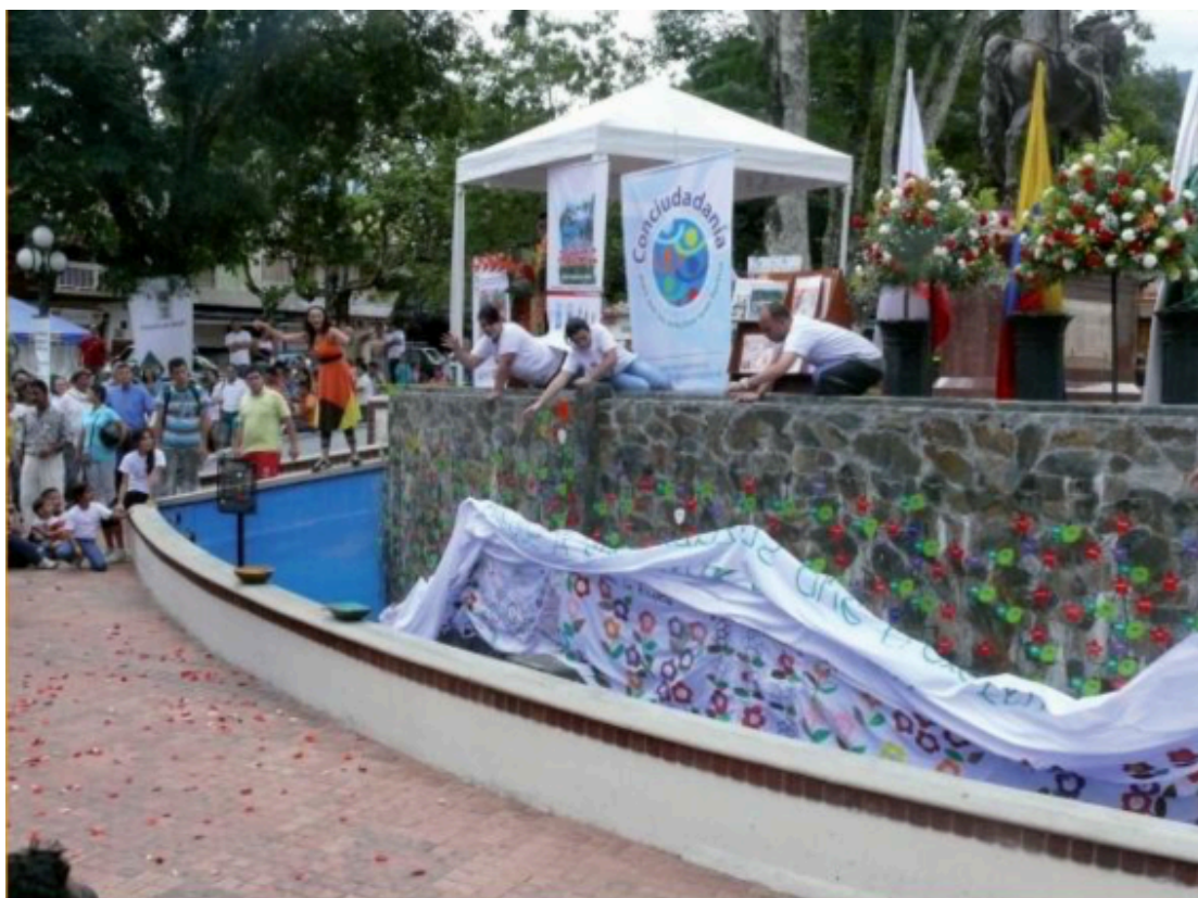
Figura 8 Fotografía Colcha de retazos "Jardín de la Memoria.

Esta colcha de retazos se enmarca en las técnicas interactivas histórico narrativas, y las expresivas, y es evidencia del trabajo de atención simultánea a gran parte de la comunidad sancarlitana víctima del conflicto social armado. Además, hace parte de la construcción del monumento del Jardín de la memoria ubicado en el Parque Principal de San Carlos, el cual es uno de los trabajos más reconocidos del CARE y Redconciliar por la valiosa información que recoge sobre las víctimas, y la forma en que logra visibilizar sus memorias.