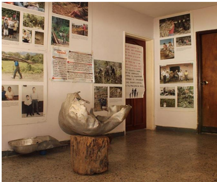
Figura 3. Fotografía del CARE.

estrategia de divulgación de la historia reciente del conflicto social armado, y particularmente de lo ocurrido en el municipio de San Carlos.