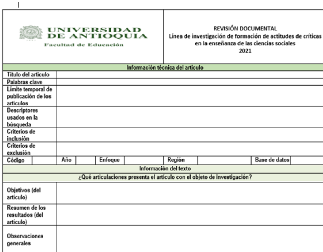
Ilustración 2. Formato de acopio de información para la revisión documental.