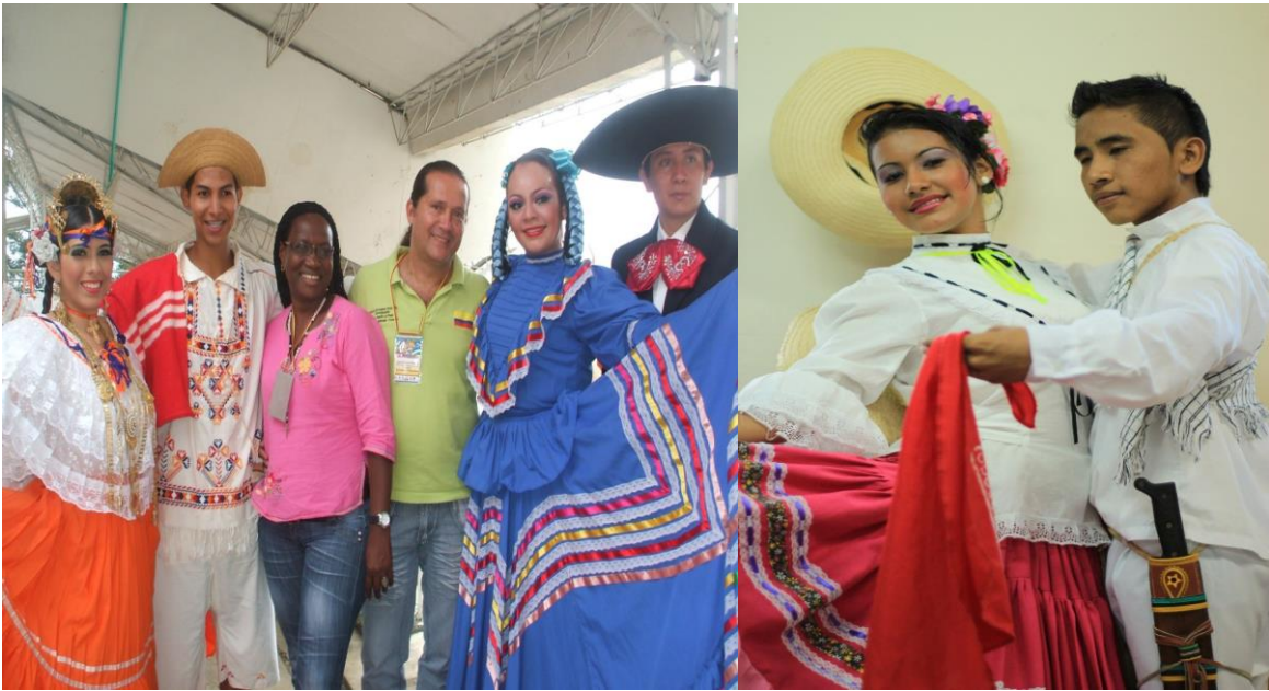
Figura 22. Delegaciones de Panamá, México y Valle del Cauca 2014 (izq.); delegación de Coyaima, Tolima (2012)