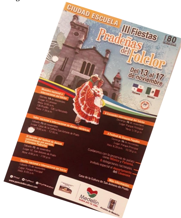
Figura 5. III Fiestas Pradeñas del Folclor. Afiche 2014