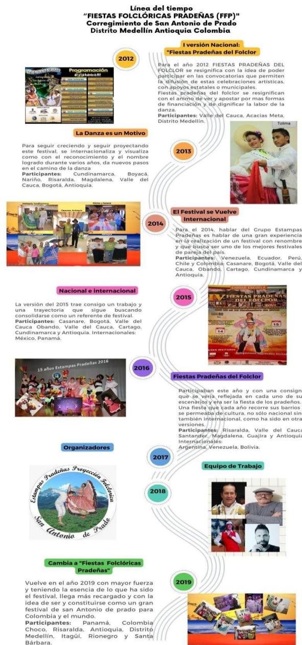
Figura 2. Fiestas Folclóricas Pradeñas (FFP). Línea de tiempo 2012-2019

Fuente: archivo Festival Fiestas Folclóricas Pradeñas, FFP (s. f.).