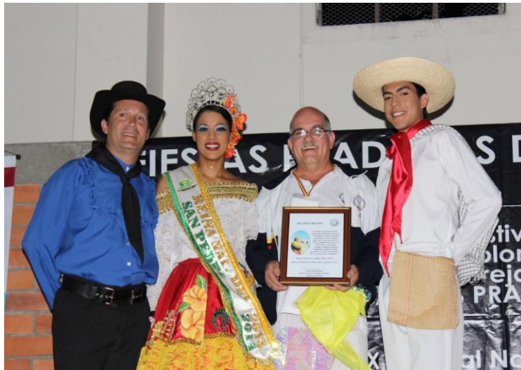
Figura 13. Agrupación Folclórica Tequendama Bogotá.