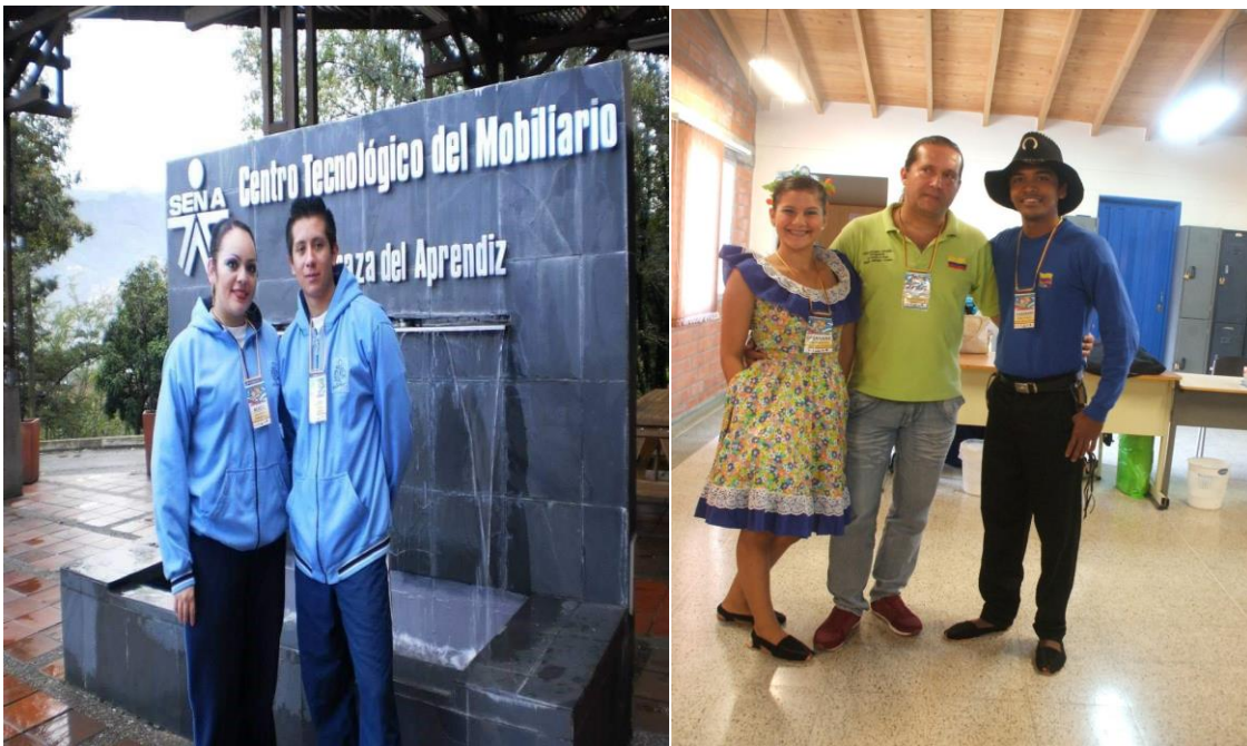
Figura 21. Delegación de México 2014 (izq.); delegación de Paz de Ariporo, Casanare (2014)