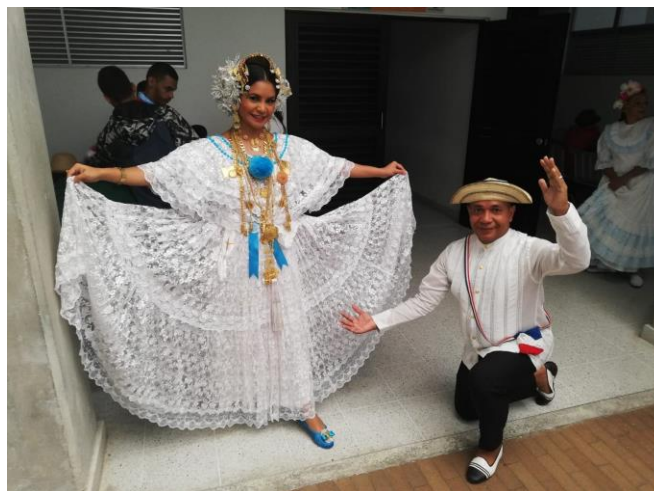
Figura 10. Pareja de danza, Grupo de Danzas Folclóricas Panamá La Chorrera