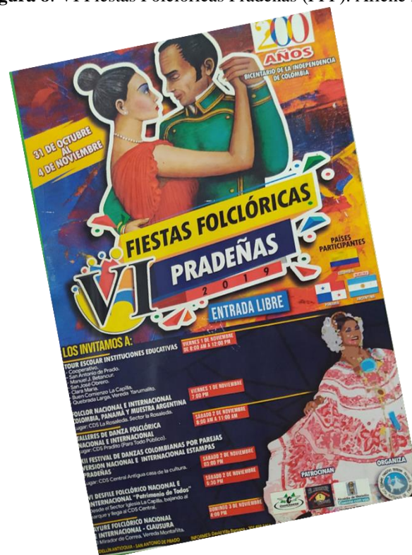
Figura 8. VI Fiestas Folclóricas Pradeñas (FFP). Afiche 2019