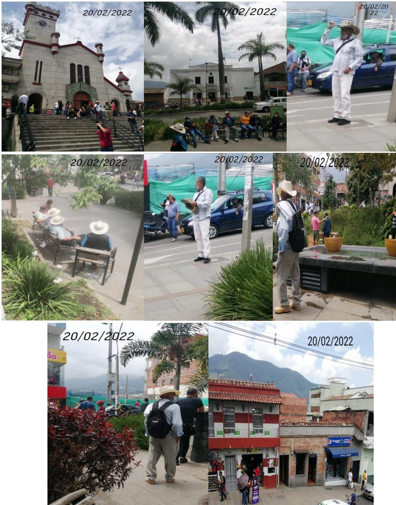
Figura 9. Registro del mapeo, comuna 80 (parque principal de San Antonio de Prado)

Fuente: archivo Festival Fiestas Folclóricas Pradeñas, FFP (s. f.).