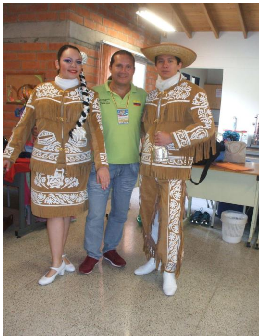
Figura 11. Pareja de danza, Ballet Folclórico Iztakuauhtli Estado de México.