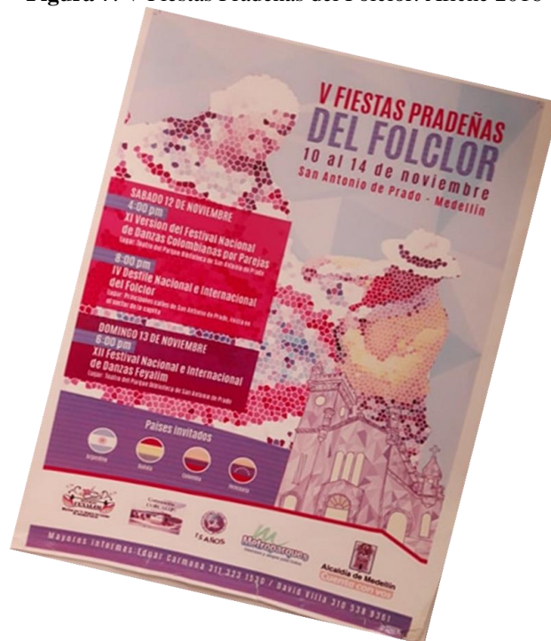
Figura 7. V Fiestas Pradeñas del Folclor. Afiche 2016