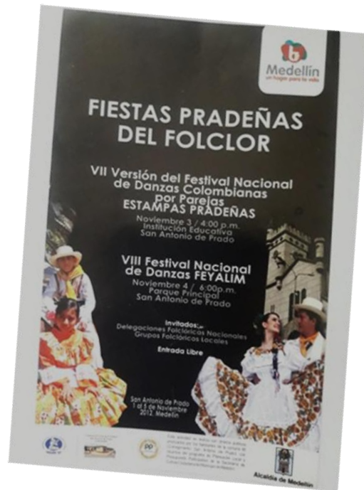
Figura 3. Fiestas Pradeñas del Folclor. Afiche 2012

Fuente: archivo Festival Fiestas Folclóricas Pradeñas, FFP (s. f.).