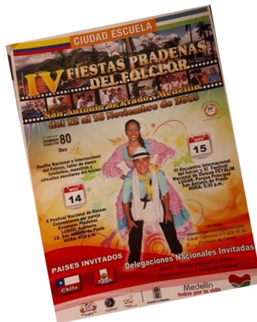
Figura 6. IV Fiestas Pradeñas del Folclor. Afiche 2015