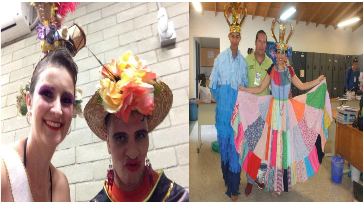
Figura 23. Delegación de San Antonio de Prado 2016 (izq.); delegación de Ciudad de Panamá 2014 (der.)