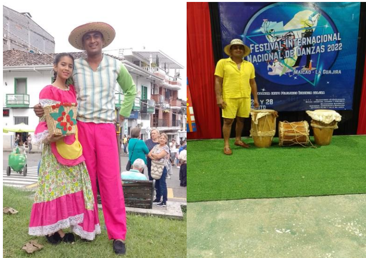
Figura 12. Grupo Folclórico Herencia Guajira Maicao.