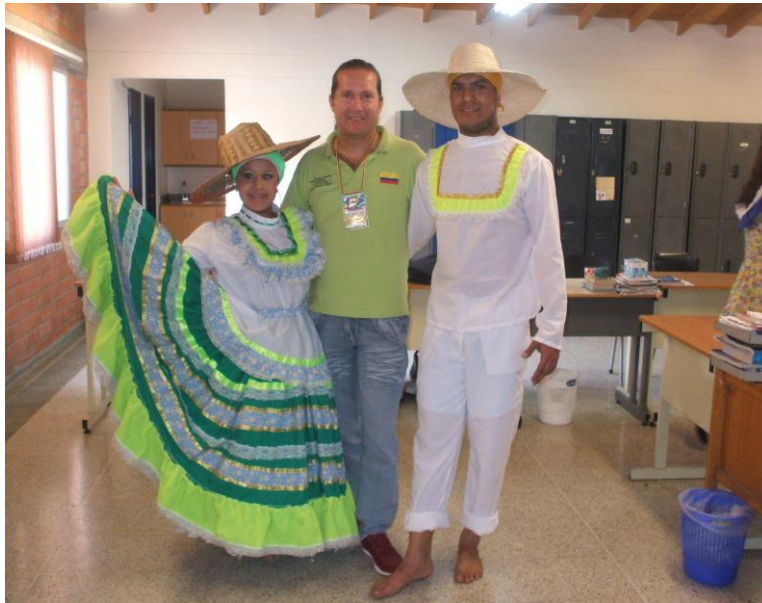
Figura 26. Delegación de Cundinamarca 2014

Fuente: archivo Danzas Estampas Pradeñas (s. f.).