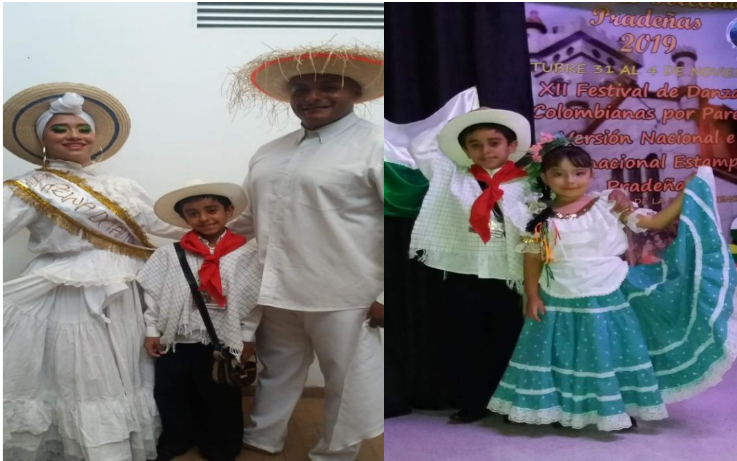
Figura 24. Delegación de Medellín (izq.); Colombia (der.) 2019

Fuente: archivo Danzas Estampas Pradeñas (s. f.).