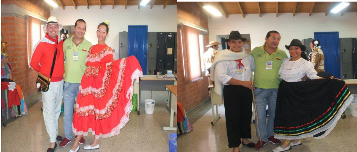
Figura 25. Delegación de Cartago y Obando (Valle del Cauca) 2014