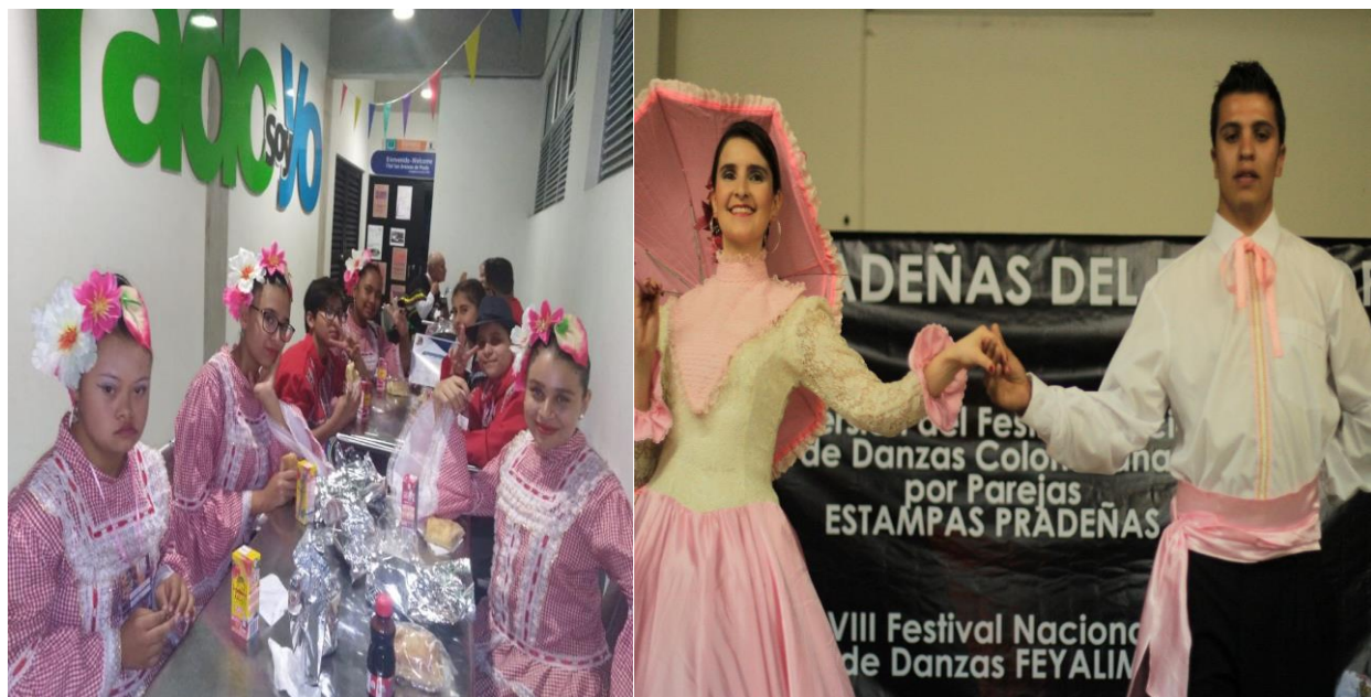
Figura 19. Itagüí 2019 (izq.), Colombia 2013 (der.)