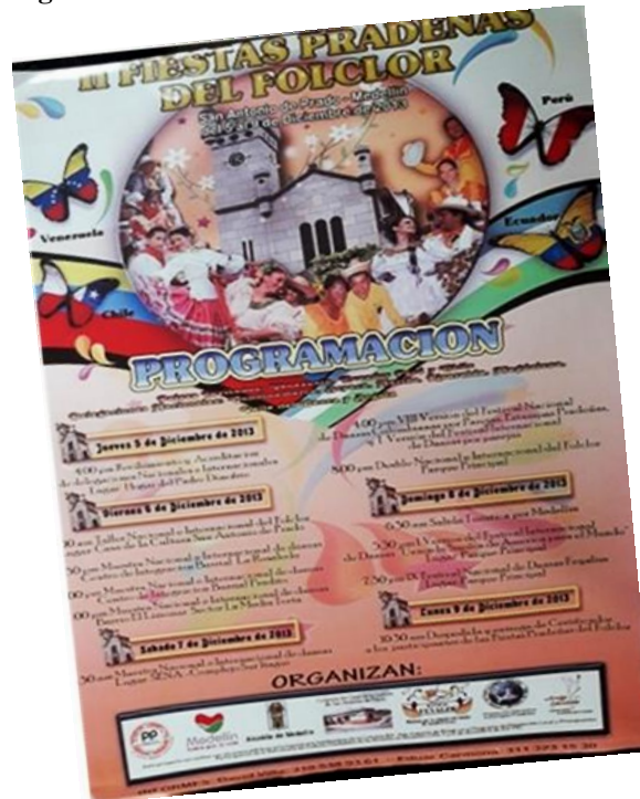
Figura 4. II Fiestas Pradeñas del Folclor. Afiche 2013