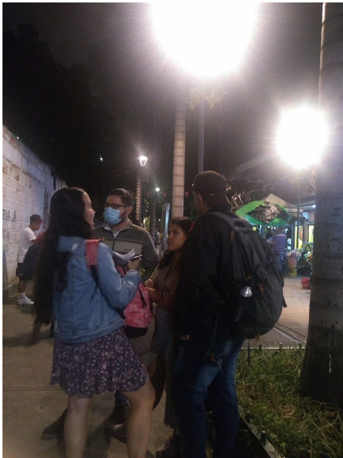
Nota. Junín. 2021. Recorrido de ciudad "Recordando ando: un recorrido por el centro de la ciudad."