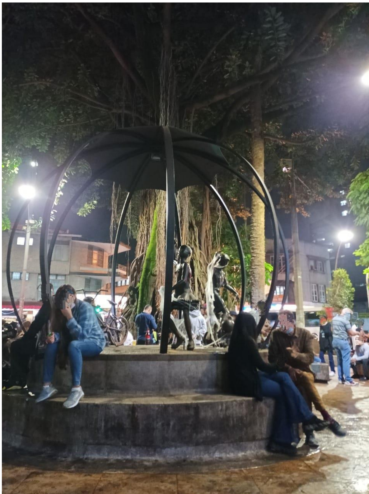
Nota. Parque El Periodista. 2021. Recorrido de ciudad "Recordando ando: un recorrido por el centro de la ciudad."