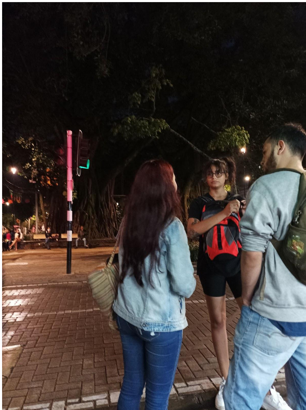
Nota. Parque Bolívar. 2021. Recorrido de ciudad "Recordando ando: un recorrido por el centro de la ciudad."