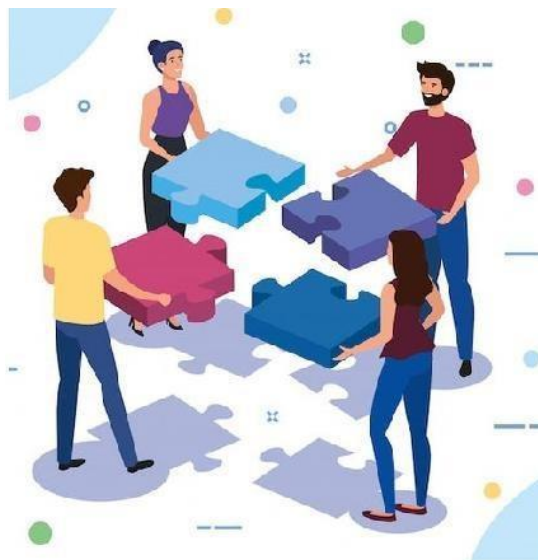
Favorecer el trabajo en equipo.

Tomadas de: propuesta de inclusión laboral sujeto 7