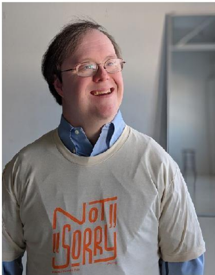
Tratar a las PcD con respeto, llamándolos siempre por su nombre o cargo, sin hacer nunca referencia a ellas por su condición.