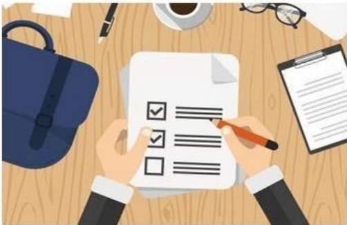
Elaborar un perfil del cargo claro y sensato, con los ajustes necesarios según las condiciones de la PcD.

En este orden de ideas, es importante entender que el concepto de “discapacidad intelectual” no es una etiqueta, ni un nombre para una persona, es solo un diagnóstico que permite brindar un acompañamiento pertinente a la persona con discapacidad que le facilite gozar con equidad de los mismos derechos que tienen los demás dentro de la sociedad; por esto, es importante que durante la interacción con personas que presenten este tipo de discapacidad, se use su nombre y, sin desconocer sus limitaciones, se genere cercanía de manera natural y respetuosa, poniendo al individuo por delante de su diagnóstico.