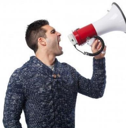
Utilizar siempre el mismo nivel de voz para comunicarse con todos los miembros de la empresa, sin utilizar nunca un tono particular para las PcD, a menos que ella se lo pida o su condición particular lo amerite.