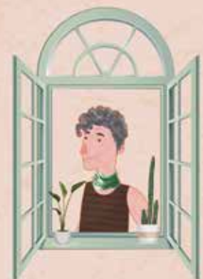
Silvia Federici (Italia, 1942). Revitalizadora de brujas y herejes, renovadora del marxismo, anticapitalista e impulsora de una economía feminista de los comunes.