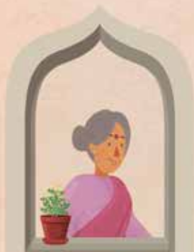
Vandana Shiva (India, 1952). Defensora de todas las formas de vida de la Tierra. Ecofeminista, escritora, científica cuántica y filósofa de los paradigmas emergentes.