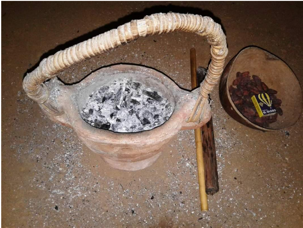
Ilustración2: Fotografía del sahumero de cacao.

Desde comienzo del proceso de la semilla, recorrí el camino junto con los sabios y sabios, autoridades tradicionales y líderes de la comunidad, que me acompañaron en este proceso de tejido de mi semilla para llegar a los resultados y fueron camino largo, acercando a los sabios, haciendo diálogos, entrevistas, recolectando la información de la historia y de la comunidad.