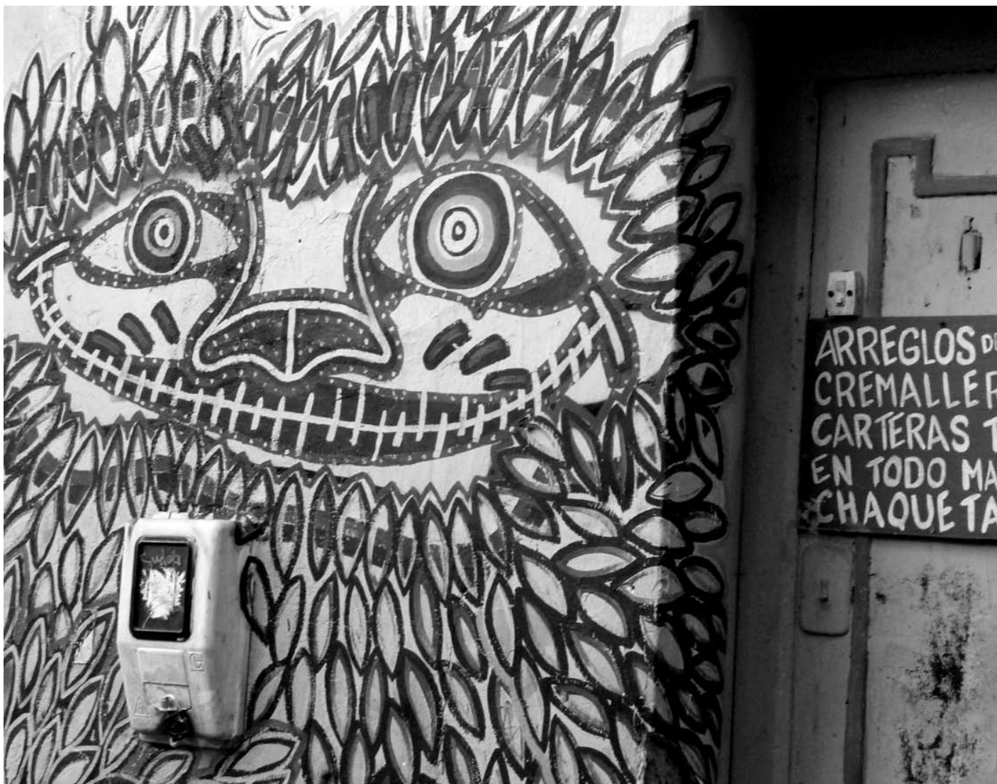
Graffiti. BOGOTÁ

los hijos sigan el camino correcto, intervienen drásticamente en la vida de estos últimos, prohibiéndoles formas de ser, hacer, estar y tener que rompen con los cánones considerados correctos por los adultos. Sobre esta situación es ilustrativa la siguiente narración de una mujer vinculada con un grupo juvenil que trabaja la perspectiva de género: