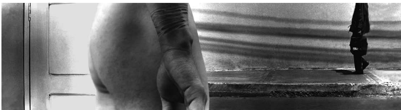
ANA ADARVE | Sobre lo cotidiano 2 ; 40 x 150 cm. Fotografía a color, 1998.