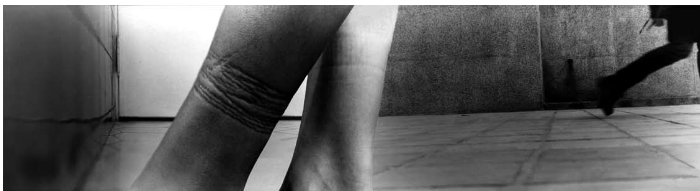
ANA ADARVE | Sobre lo cotidiano 3 ; 40 x 150 cm. Fotografía a color, 1998.