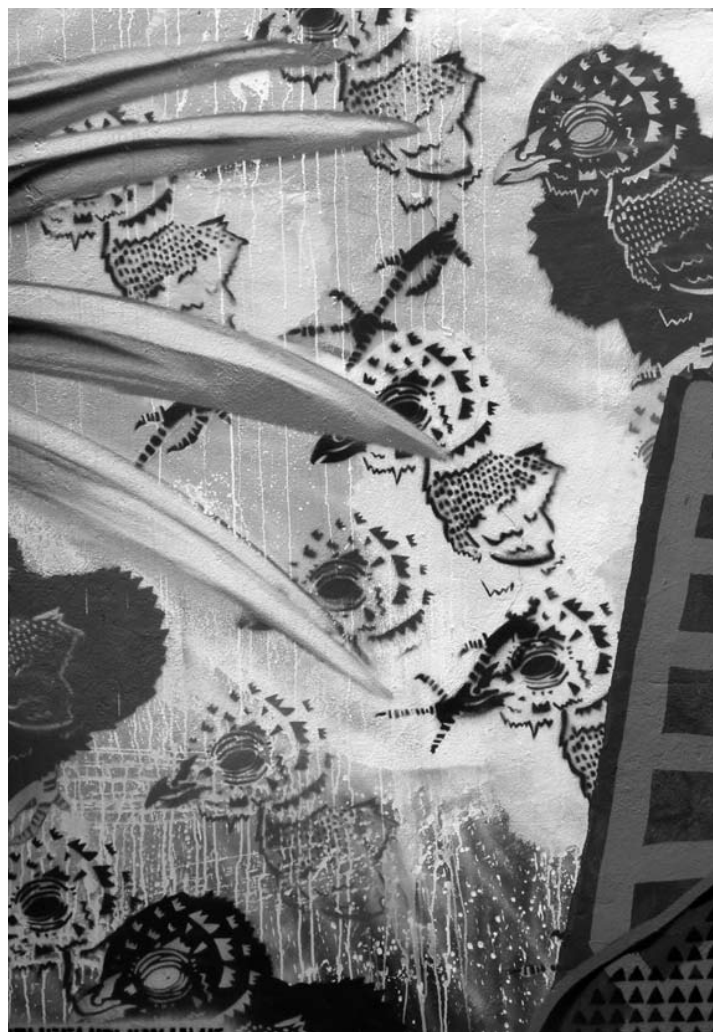
Graffiti. BOGOTÁ

Los valores democráticos que comportan estas propuestas conducen a relieves la preponderancia del reconocimiento del Otro, de proteger la diferencia que expresa cada forma de vida particular y la riqueza que subyace en la pluralidad (Arendt, 1998). Uno de los elementos que permiten realizar esta afirmación consiste en el rechazo que estos grupos hacen de toda forma de violencia, para ellos la violencia es la negación del reconocimiento, del derecho a tener derechos que cabe a todo ser humano. Para estos jóvenes los derechos son objeto de disputa política pero sin necesidad de recurrir a la violencia. La manera de preparar a los jóvenes para