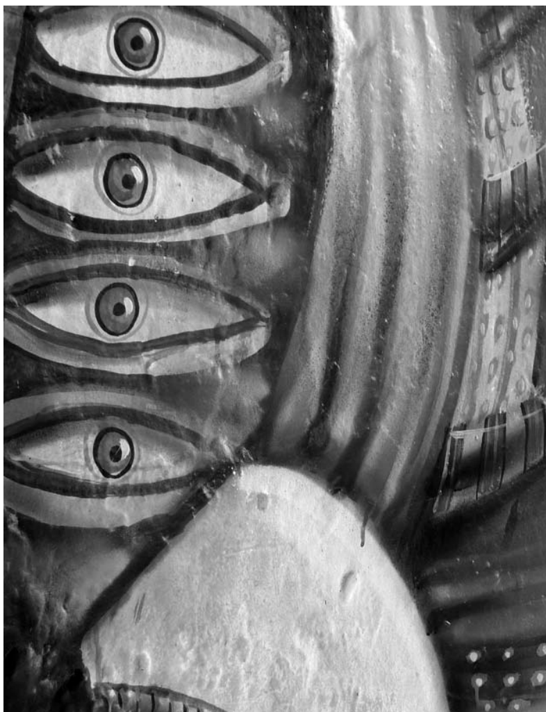
Graffiti. BOGOTÁ

blica de los excluidos en procura de ser reconocidos por el otro como sujetos autónomos y, por tanto, como portadores de pretensiones legítimas que reclaman aceptación social para poder desarrollar fácticamente los planes de acción que concretan su identidad. La lucha por el reconocimiento expresa así los esfuerzos de los excluidos por hacer parte de un orden que posibilite la vivencia plena de su subjetividad 3 .