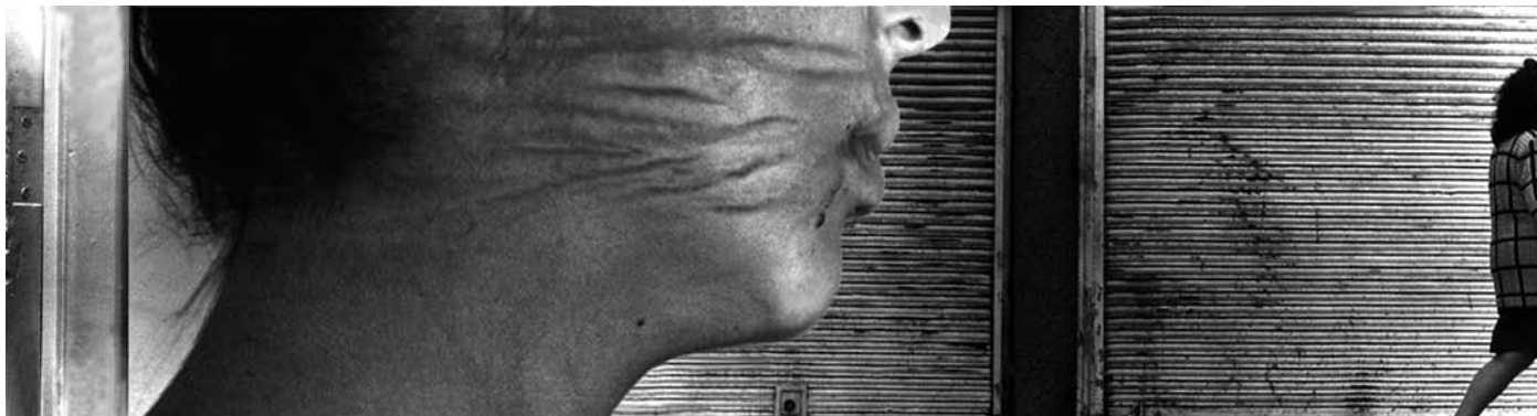
ANA ADARVE | Sobre lo cotidiano 1 ; 40 x 150 cm. Fotografía a color, 1998.