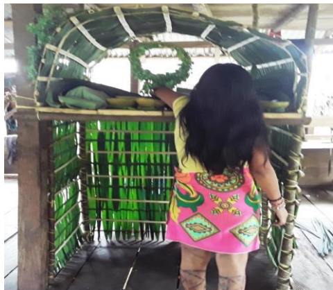
Figura 8 Proceso de preparación de ceremonia espiritual el Kua significa ¿Cómo está?