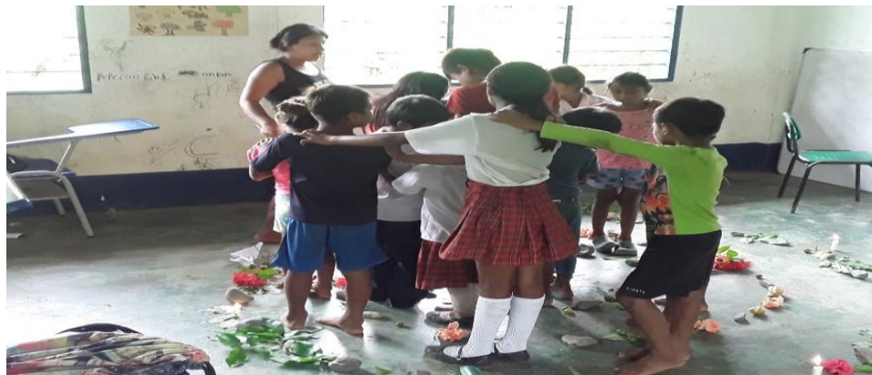
Figura 12 Los estudiantes danzando en espiral en medio de plantas medicinales.