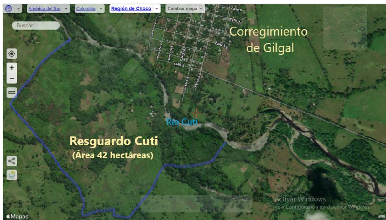
Figura 5 Mapa satelital