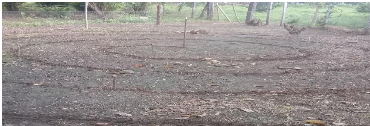
Figura 1 Terreno para la siembra de las plantas medicinales