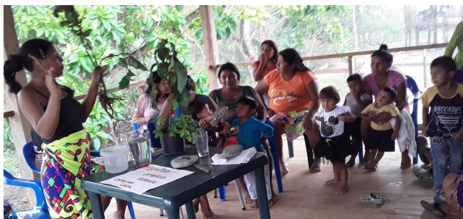
Figura 13 Descripción de la planta Bipuado