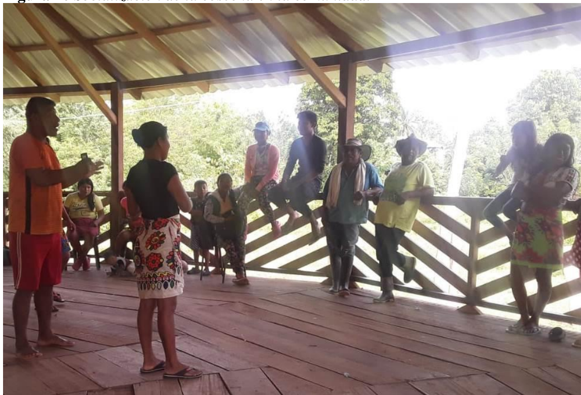
Figura 20 Socialización de la cosecha en la comunidad.

el resultado esperado. Agradeciendo al gobernador por permitir y acompañar en este proceso de caminar del proyecto. También fue gran aporte de los Sabios y sabias de la comunidad.