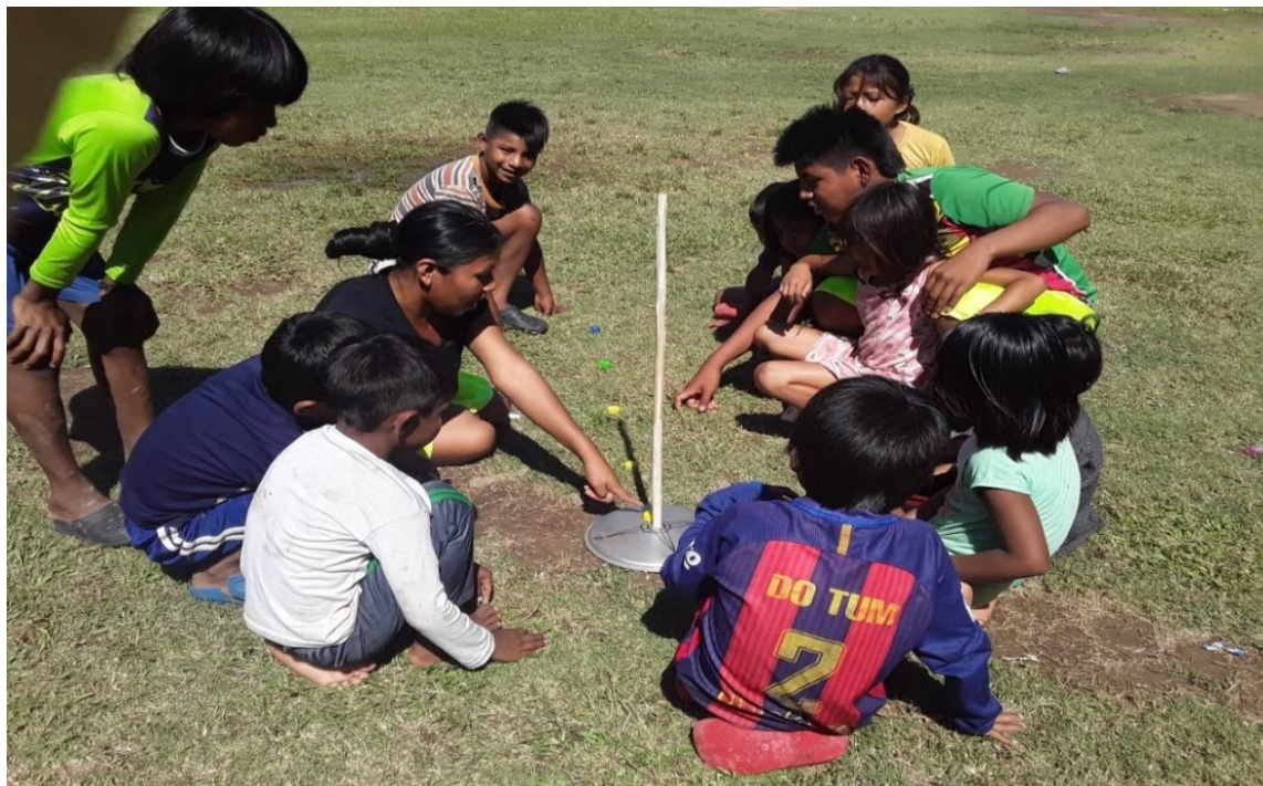
Figura 7 Observación de movimiento del Sol con los estudiantes

Fuente: Edilma Domico. Cuti, 12/11/2020.