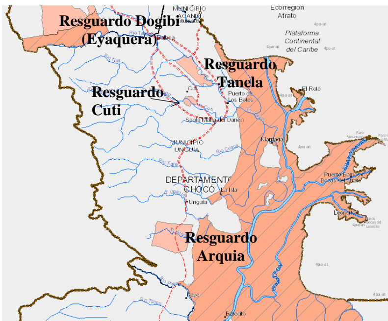
Figura 6 Ubicación del resguardo Cuti