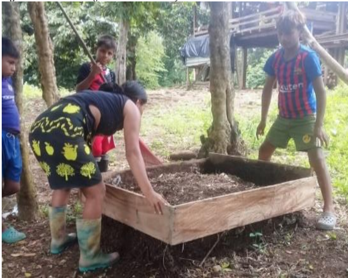
Figura 16 Paca de Biodigestor: retirando el cajón de madera.