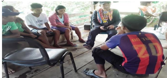
Figura 11 Escuchando al sabio Paisano Domico sobre la importancia de las plantas medicinales y ceremonias

Fuente: Célida Patricia D, Cutí 24/01/2020.