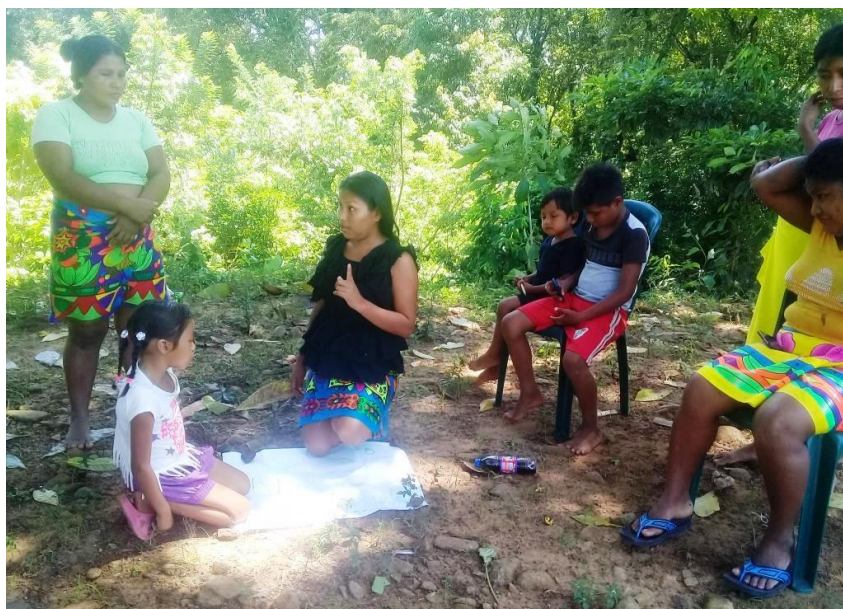
Figura 10 Socialización de la semilla en el encuentro local en Cuti.

Fuente: Edilma Domico. Cuti, 27/05/2019.