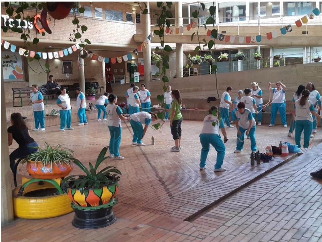
Mujeres del Club de Vida realizando la gimnasia.