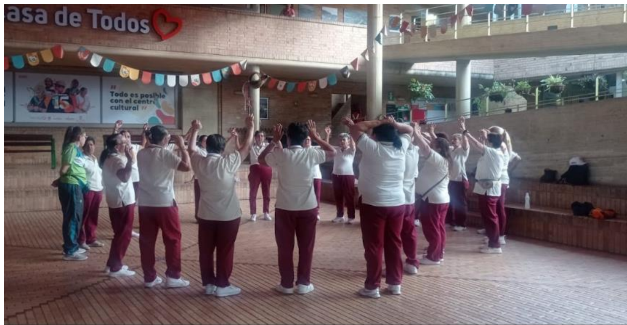
Mujeres del Club Encantos por la Vida

Es importante resaltar y agradecer a las mujeres que hicieron parte del estudio de caso, ellas son pertenecientes al Club de vida Encantos por la vida del barrio Moravia, en su mayoría llevan más de 7 años en el Club, y viviendo en el sector más de 25 años, son mujeres amas de casa, dedicadas en su mayoría al cuidado de los nietos y labores domésticas, los rangos de edad de las