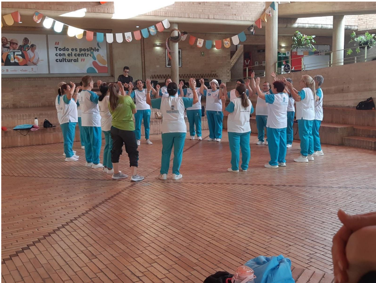
Realizan el ritual de inicio a la actividad, canto de adulto mayor y oración.

Por consiguiente, se evidencia como este Club de Vida representa para las mujeres un lugar para desarrollar diferentes actividades de esparcimiento, entretenimiento y disfrute. Sin embargo, lo trascendental que tiene para sus vidas es un poco más amplio y profundo ya que allí comparten de manera afectiva con las diferentes personas, sienten que llegan a un lugar que proporciona vida y salud, que valora el ciclo vital en el que están y que a partir del relacionamiento y la socialización permanente se va convirtiendo en la configuración de una red de vínculos y relaciones significativas en su presente, construyen conexión y comunidad, compartiendo intereses similares, adicionando otros sentidos a la vida, así las relaciones y colaboración entre ellas se convierte en una fuente importante de apoyo y satisfacción, fortaleciendo y creando emociones y afectos que como sostiene Antonio Damasio (2021) en su teoría sobre las prácticas afectivas, son fundamentales en la vida de las personas y desempeñan un papel crucial en el bienestar emocional y social, ligado a esto mantener emociones y afectos dan sentido a la vida y contribuyen a la