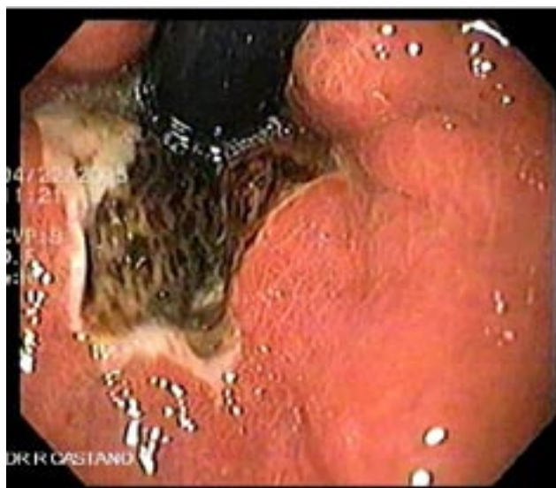
Figura 2. Paciente del caso 1 y retrovisión donde se demuestran claramente los límites de la necrosis esofágica aguda y el estómago normal