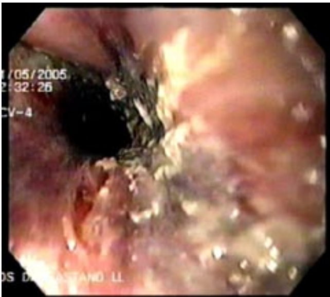
Figura 3. Esófago negro de paciente del caso 2 con antecedente de irradiación en tórax, nótese la fibrina local y la ulceración superficial.

Mujer de 69 años. Tiene antecedente de hipertensión controlada con enalapril y de mastectomía radical por cáncer de seno con quimiorradioterapia hace 2 años. Cursa ahora con metástasis hepáticas documentadas por biopsia dirigida por TAC y está icterica. En la última semana su condición general viene en franco deterioro y como evento nuevo, en los 2 últimos días ha presentado vómito oscuro sugestivo de sangrado digestivo alto. Al ingreso a urgencias se obtienen los siguientes hallazgos del examen físico y paraclínicos: presión arterial de 80/60, pulso 112/min, hemoglobina de 8,2 gr/dl, hematocrito 25%, leucocitos 4000, plaquetas 235.000 / ml, sodio 142, potasio 3,4, urea 112 mg/dl, creatinina 2,2 mg/dl, glicemia 114 mg/dl. Se le practica endoscopia (figura 3) a la mañana siguiente de su ingreso a urgencias y se documentan cambios inflamatorios y de erosión de la mucosa esofágica que característicamente presenta una extensa coloración negra desde su tercio medio hasta la unión gastroesofágica. La paciente evoluciona con cuadro sugestivo de choque séptico y falla multiorgánica y fallece 2 días más tarde.