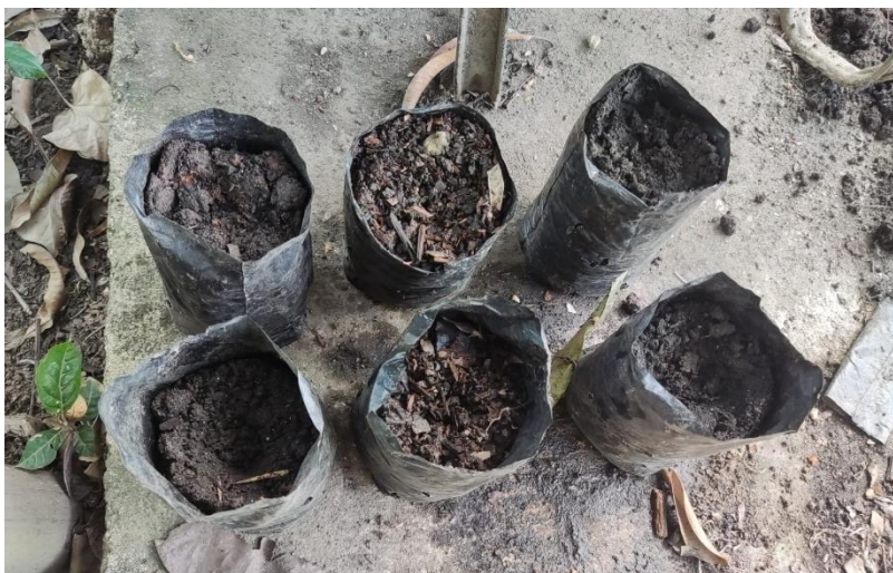
Ilustración 1 Plantación de las semillas de frijol

*Las dos primeras de izquierda a derecha son la de lodos + cenizas, los dos siguientes son los del compost y las dos de más a la derecha son de tierra negra.