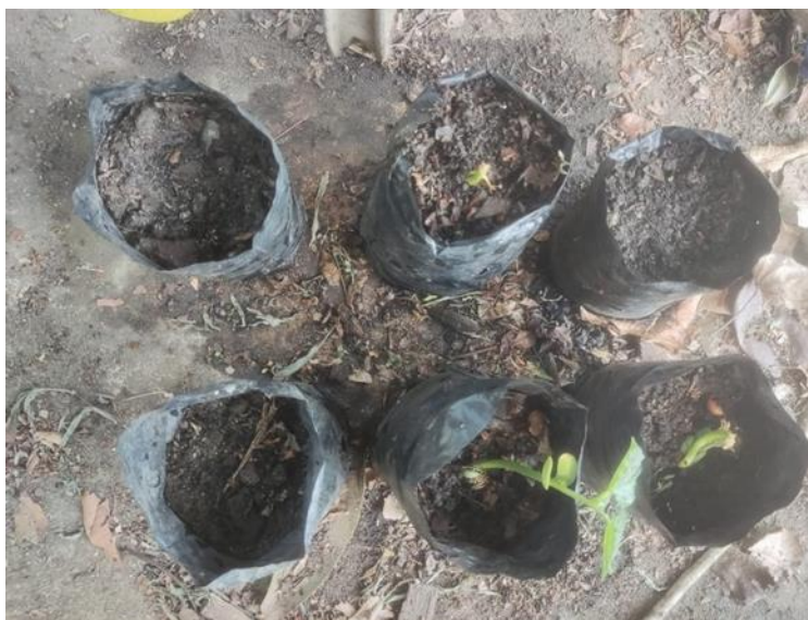
Ilustración 2 Germinación de las semillas de frijol.

*Las dos primeras de izquierda a derecha son la de lodos + cenizas, los dos siguientes son los del compost y las dos de más a la derecha son de tierra negra.