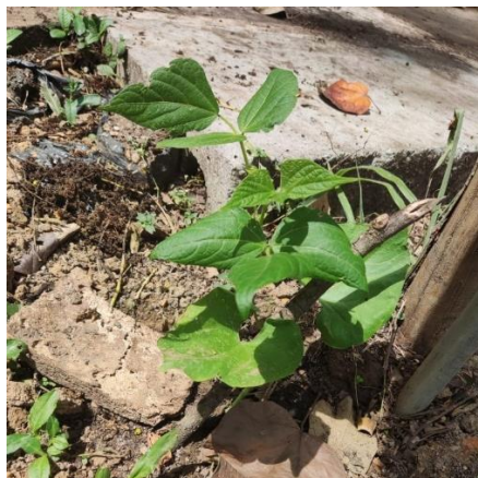
Ilustración 3 Crecimiento de la planta de frijol en abono.

* No se miden los tallos a diario, porque no se tiene acceso diario a las plantas de frijoles.