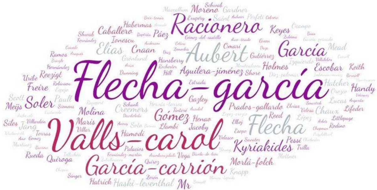
Ilustración 4. Nube de autores claves. Elaboración propia 2024.

Con base a ello se encontró que José Ramón Flecha García fue uno de los autores más mencionados, quien es un destacado sociólogo y pedagogo español, reconocido por sus contribuciones en el campo de la educación, es especialmente conocido por su trabajo en el desarrollo de la Teoría de la Comunicación Dialógica y su aplicación en el ámbito educativo, ha investigado y promovido estrategias pedagógicas centradas en el diálogo y la participación activa de los estudiantes en el proceso de enseñanza-aprendizaje. Flecha García ha publicado numerosos libros y artículos sobre temas relacionados con la educación inclusiva, el aprendizaje dialógico y la transformación social a través de la educación y el aprendizaje dialógico, razón por la cual, al ser estos ejes fundamentales del programa, se explica que sea un autor importante encontrado en los distintos documentos sobre el mismo.