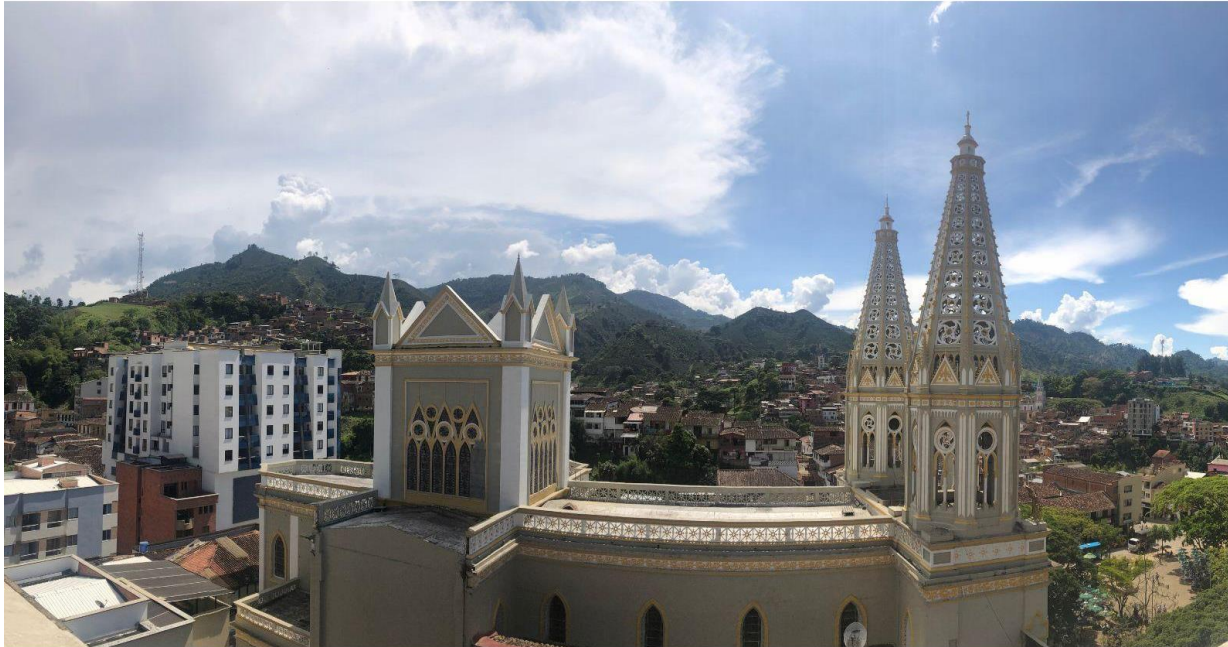
Ilustración 1. Vista panorámica municipio de Andes.