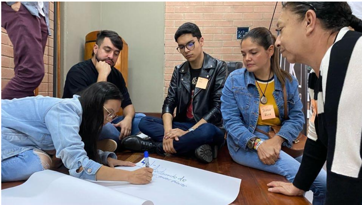
Ilustración 6. Taller DRP con agentes culturales de Andes.

El DRP “Formación de públicos, Pedagogía Social para el Arte y la Cultura” fue realizado en el auditorio de la ciudadela educativa de Andes, el 06 de junio de 2022 de 5 a 8 pm, para este