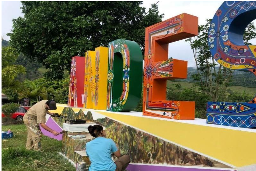
Ilustración 3. Obra realizada por la SMP en alianza con diferentes artistas locales.