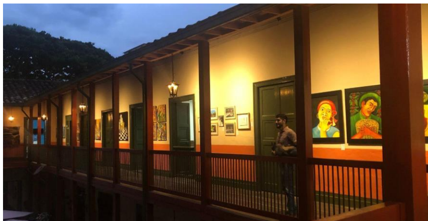
Ilustración 2. Edificio SMP, Palacio del ayuntamiento Andes.