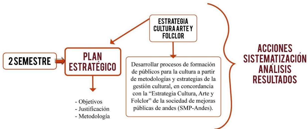
Ilustración 8. Ruta de trabajo semestre 2.

De acuerdo al análisis de los instrumentos de recolección de la información implementados en la ruta de trabajo 1, fue posible desarrollar un plan estratégico de intervención como proyecto piloto de formación de públicos en el municipio de Andes, donde cada acción responde a un amplio