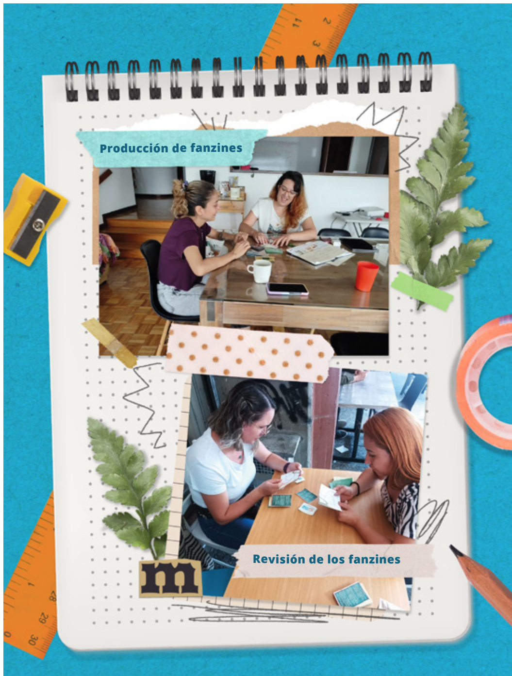
Imagen 1. Producción de fanzines y revisión de los fanzines

ilustraciones; y finalmente, se difundieron y compartieron los fanzines con la comunidad académica y escolar. Como resultado, se crearon cinco fanzines que presentan una serie de relatos emergentes de la vida en las aulas.