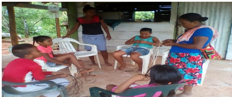
Ilustración 1 Encuentro local

Durante este proyecto, así como se han tenido logros también he tenido dificultad y una de esas fue la pandemia llamada coronavirus que se dio en el año 2020 a nivel mundial, no solo afecto a las grandes ciudades también nuestras comunidades sufrieron el efecto de la crisis mundial.