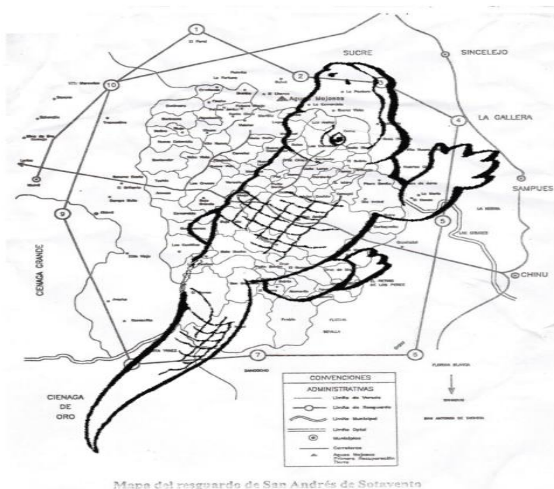
Ilustración 3 mapa asentamiento senu.

En el desarrollo de la investigación se centra en la provincia Finzenu, donde está ubicado el Resguardo de San Andrés de Sotavento, ya que se dedican a la artesanía, aunque en alguno de los relatos se haga alusión a la hermandad que existió ente estas tres regiones Zenúes (castillo, 2011).