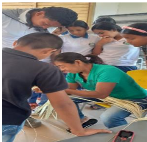
Ilustración 5 encuentro local

En la comunidad indígena El Pando se vive una situación de violencia, y es una zona donde transitan grupos armados que buscan que nuestros comuneros ingresen a sus grupos, es por esto que se busca que, por modio de la práctica de las artesanías, y las historias y los significados propios se siga manteniendo a nuestras niñas, niños y jóvenes alejados de grupos ilegales.