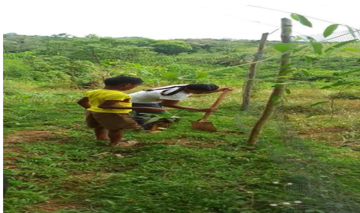
Ilustración 4 realizacion huerta casera encuentro local

También se trabaja actividades pedagógicas con los estudiantes como la semana de las identidades, las muestras de comidas tradicionales, la feria de la artesanía, la fiesta de la familia, elección del