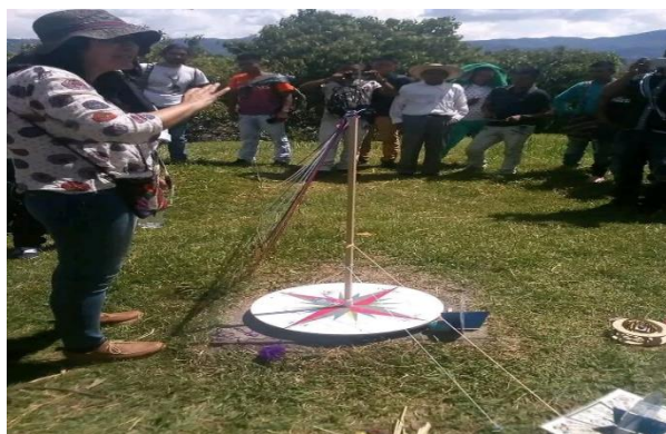
Ilustración 2 Encuentro regional

Durante este camino recorrido he sentido el llamado de la comunidad a seguirme fortaleciendo y a participar en los procesos organizativos en diferentes aspectos tanto de manera personal y comunitaria, ya que en el transcurso de este proyecto he tenido la oportunidad de participar en el liderazgo organizativo.