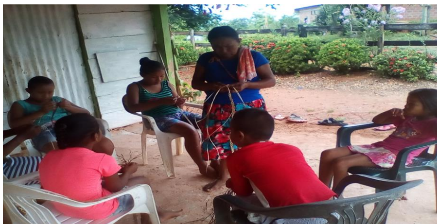
Ilustración 8 encuentro local practica de las pintas del sombrero bueltiao

Otras de las técnicas de recolección de la información fueron los conversatorios con artesanas donde se realizó encuentro con el grupo de jóvenes, también con los niños y niñas de la comunidad donde se iba hablando desde la manera de concebir la artesanía, su elaboración y sus representaciones, así iba orientando y tomando notas para construir el proceso de recolección de información.