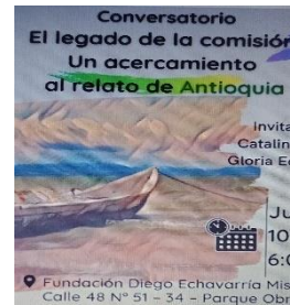
Foto 5.

Estas imágenes dan cuenta de los espacios acogedores y de la creativa y variada oferta de programas, pensados y realizados con el alma para el heterogéneo grupo de usuarios Bibliodem: Taller de bordado. (Des)tejiendo miradas. Herramientas para una pedagogía de la paz y el diálogo social en Colombia. Los invitamos a participar de los talleres de bordado con sentido “Puntadas para hilar la memoria y (des) tejer miradas [web Bibliodem, 2024].