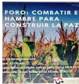
Foto 2. Web Bibliodem: http://bibliodem.org/sitio/ Consultado febrero 18/2024