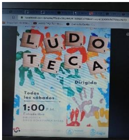
Foto 1.