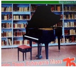
Foto 3. Web Bibliodem: http://bibliodem.org/sitio/ Consultado febrero 18/2024