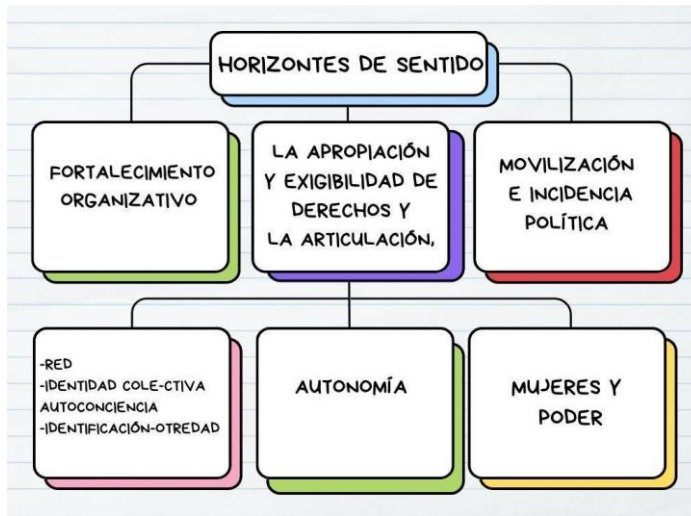
Figura 3 Horizonte de sentido

Para que haya un fortalecimiento organizativo debe de haber primero una identidad colectiva, un espacio de articulación y de juntanza, y unos objetivos previos que las unifiquen, por lo que el sentido político que tuvo inicialmente el programa de mujeres fue la consolidación de grupos que más adelante se convirtieron en redes. Esto marcó un hito importante y trazó el primer sentido del programa, centrado en la importancia de que las mujeres se encuentren, salgan del ámbito privado que es colectivo y familiar y las borra como sujetas con autonomía,