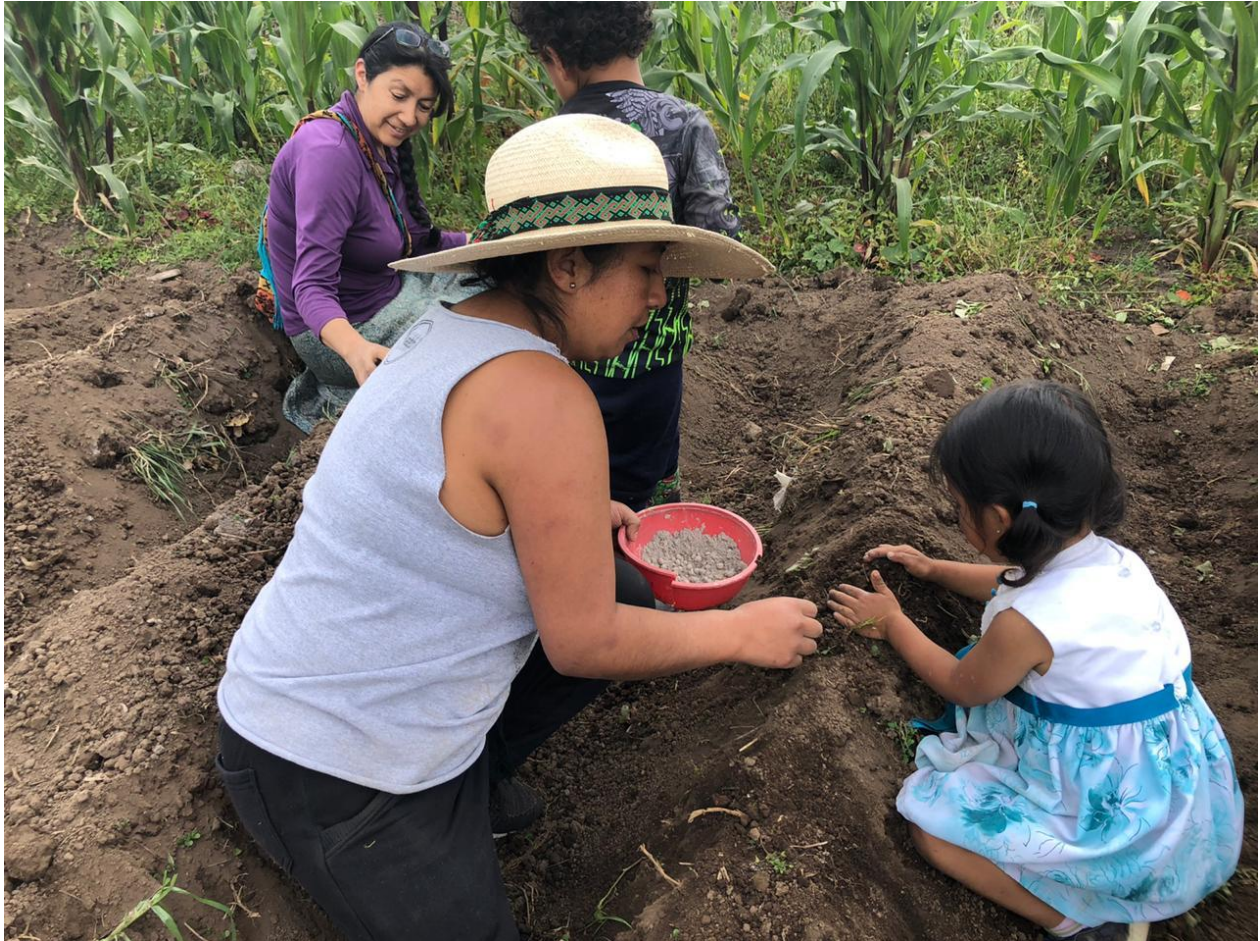
Figura 2 Chagra

Nota. Asociación de Indígenas del Norte del Cauca