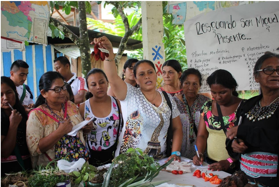
Figura 4 Mujeres hacen el mercado

cosas que van a comprar, pero yo digo que en la pandemia se invirtió el papel, por ejemplo, en mi casa el único que salió fue mi papá y como en el pueblo cerraron todas las tiendas le toco ir a Ipiales. Él salía por lo menos una o dos veces al mes y le tocaba hacer todo el mercado (C. J. Aza, comunicación personal, 2 de marzo, 2021).