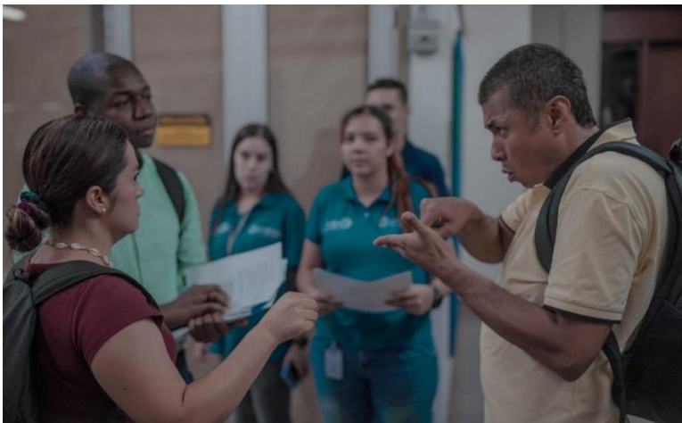
Figura 2. Cultura sorda de la UdeA

En el marco del respeto y promoción de los derechos humanos, la discapacidad presenta desafíos particulares que requieren un enfoque inclusivo y adaptativo. Las políticas y prácticas orientadas a las personas con discapacidad buscan garantizar sus derechos fundamentales, promover su plena integración y participación en la sociedad. En este contexto, la Universidad de Antioquia (UdeA) en Colombia ha tomado medidas significativas para asegurar que la comunidad sorda tenga acceso a la educación superior y disfrute de una experiencia universitaria completa y enriquecedora (Ospina Sánchez, 2023).