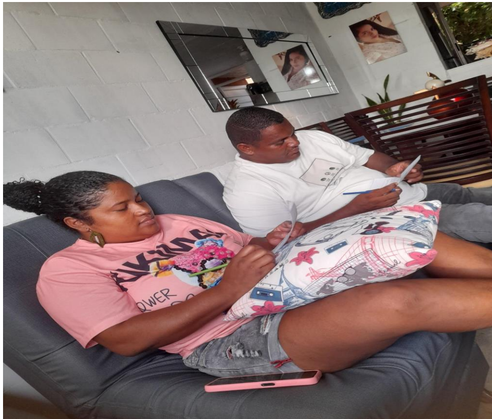
Casa a casa asertivisita