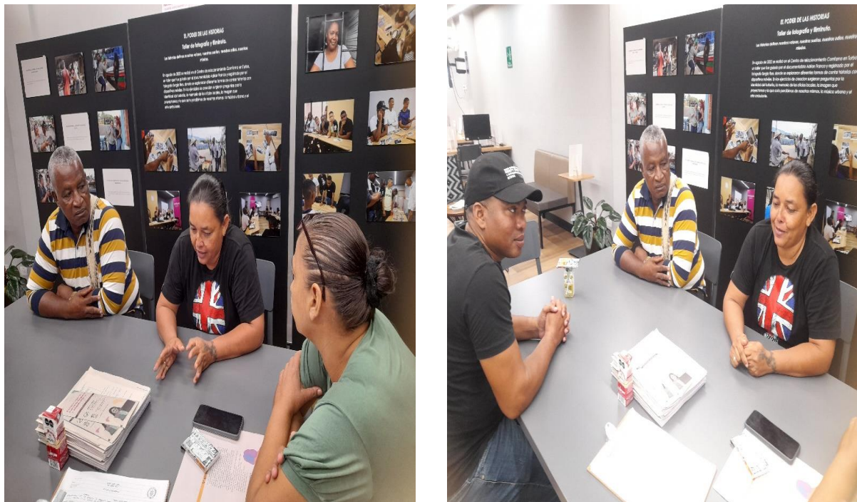
Figura 10 Consejo de Administración

Como complemento de esta actividad, la Trabajadora Social realizó el acta de conformación del Consejo.