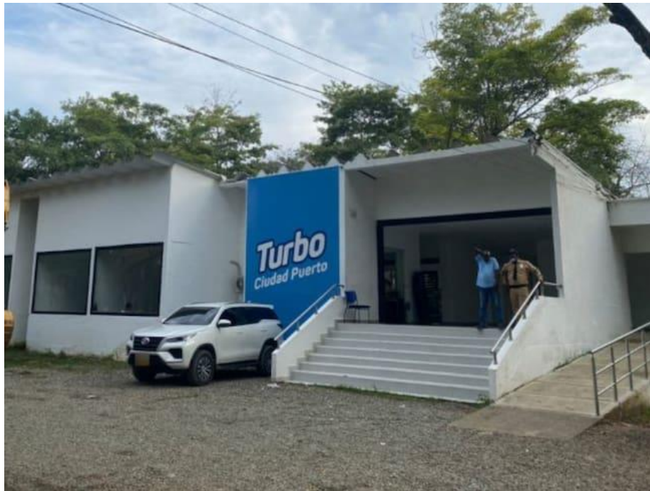
Alcaldía Distrital de Turbo

Nota. Fuente https://www.wradio.com.co/2023/03/29/a-pesar-de-deudas-alcaldia-de-turbo-sigue-contratando-personal/ (Ortíz, 2023)