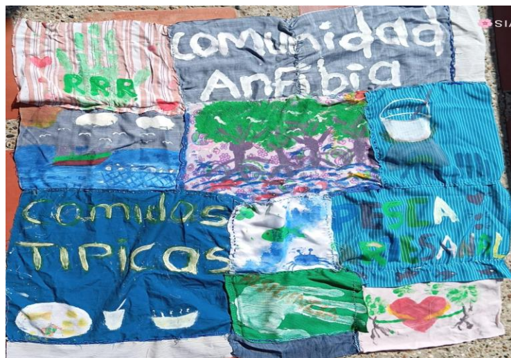
Figura 12 Colcha de Retazos

La otra actividad que sirve como medio de verificación sobre el cumplimiento de este objetivo en cuanto a la construcción de esta memoria, fue el video tipo documental el cual se