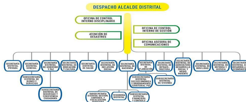
Organigrama Alcaldía Distrital de Turbo.

Nota. Sitio web Alcaldía Municipal de Turbo, marzo de 2023: https://www.turbo-antioquia.gov.co/NuestraAlcaldia/Paginas/Organigrama.aspx