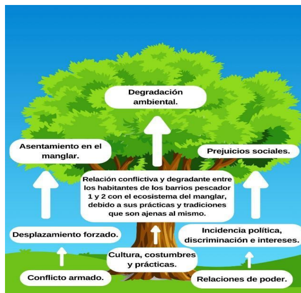
Figura 2 Árbol del Problema

Para la priorización de la problemática que se abordará en este proyecto de intervención, se optó por la elaboración de un árbol de problemas, en el cual se expone la naturaleza y contexto de la problemática socio ambiental, la información ahí contenida es insumo de unas entrevistas informales realizadas a los líderes comunitarios de los barrios pescador 1 y 2, que desde sus oratorias lograron desglosar la problemática, pues mencionaron lo que para ellos son las causas y posibles efectos.