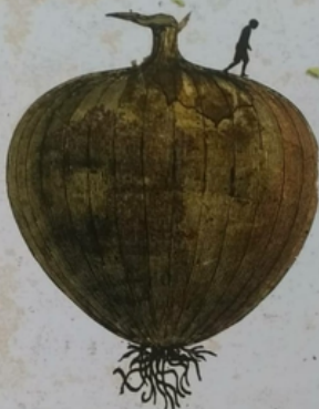
Libro de lágrimas

La creación literaria comenzó aquí. Con sorpresas e incertidumbre, también con muchos temores. Escribir literatura, pensar diferente, construir sentido de una forma diferente, el uso diferente del lenguaje, todo ello, significó un reto para todas. Empezar estos ejercicios de creación reestructuraron las formas de hacer y de pensar de cada una de nosotras. Pensar en literatura, en crearla es un ejercicio que requiere de práctica, una habilidad que se construye y que aún así, muchas veces no fluye tan fácil.