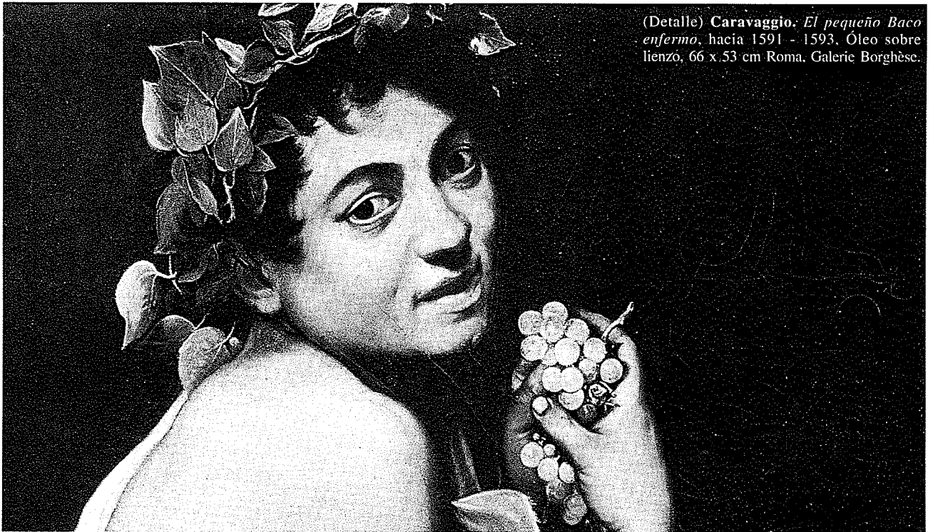
(Detalle) Caravaggio. El pequeño Baco enfermo , hacia 1591 - 1593. Óleo sobre lienzo, 66 x 53 cm Roma. Galerie Borghèse.

Los problemas y necesidades de salud de la persona, familia o comunidad se identifican por medio de una adecuada valoración, la cual es una estrategia útil para formular con objetividad las órdenes de cuidado y definir con certeza la prioridad para cumplirlas. El control de calidad del cuidado depende del diseño de un sistema que permita evaluar la gestión y el impacto de la ejecución oportuna del plan de cuidados. Dicha evaluación está referenciada por la programación de las actividades de enfermería, el diseño de estándares, guías y protocolos. Sus resultados son el soporte para plantear y desarrollar propuestas de mejoramiento