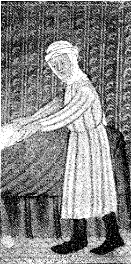
MAKING A BED, Guillaume de Digulleville - October 13

Agradecimientos: Las autoras agradecemos a las enfermeras, que voluntariamente compartieron con nosotras sus experiencias.