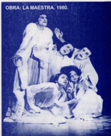
OBRA: LA MAESTRA. 1980.

La actividad teatral académica y artística de docentes, estudiantes y creadores es tangible no sólo en el aula de clase y en los espectáculos escénicos, sino también en los documentos: fotografías, afiches, programas de mano, planes de estudio, videos, memorias, trabajos de investigación, artículos de prensa, vestuario, utilería, escenografía, entre otros. Con estos registros tratamos de capturar de manera permanente la esencia del hecho efímero y vital del acontecimiento escénico. El teatro en sus "documentos" es pues, el intento de plasmar la Permanencia del Teatro en la Universidad de Antioquia; asumiendo su esencia y condición de patrimonio artístico el cual debe ser recuperado y transmitido a las nuevas generaciones.