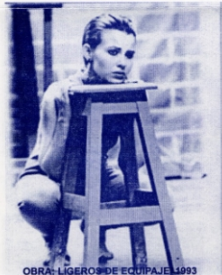
OBRA: LIGERO DE EQUIPAJE. 1993

La Exposición es apenas un intento por capturar de cada momento escénico, su acción, su sentido, pensamiento y emoción, así como la trascendencia en los espectadores y en la cultura nacional del teatro; por ello, en complicidad con quienes nos acompañan desde aquel entonces y con el recuerdo y reconocimiento a los ya ausentes, podemos dar cuenta de LA PERMANENCIA DE LO EFÍMERO; de aquella labor artística que se labra a cada momento, de la cual queda una memoria, vivencia de sus creadores, compartida en su momento con los espectadores, y plasmada en el testimonio documental que hoy presentamos.