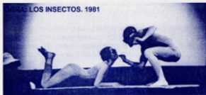
OBRA: LOS INSECTOS. 1981