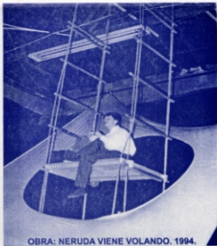
OBRA: NERUDA VIENE VOLANDO. 1994.