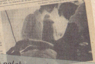
Un grupo de mujeres que participaron en el estudio.

El estudio se realizó en Bogotá y en los departamentos de Cundinamarca y Boyacá. El estudio se realizó en Bogotá y en los departamentos de Cundinamarca y Boyacá. El estudio se realizó en Bogotá y en los departamentos de Cundinamarca y Boyacá. El estudio se realizó en Bogotá y en los departamentos de Cundinamarca y Boyacá.