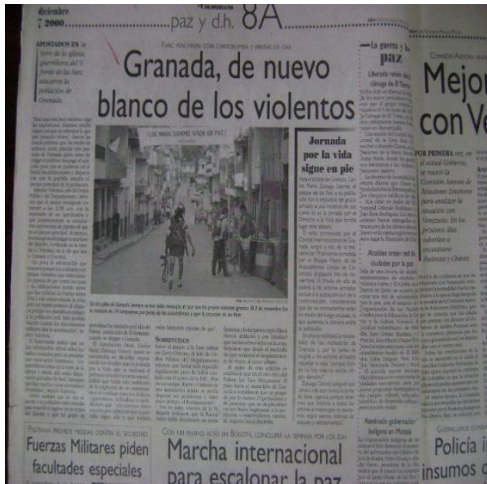
IMAGEN N.3: NARRACIÓN DE EL COLOMBIANO

El Colombiano también tiene su forma de contar el suceso, claro está, su idea principal no es el uso del carro bomba de las FARC, sino que es mucho más amplia y habla de la violencia que vive Granada con este hecho, lo cual le permite también quitarle un poco de protagonismo a la guerrilla y hablar de otros actores como el Ejército y la población civil.