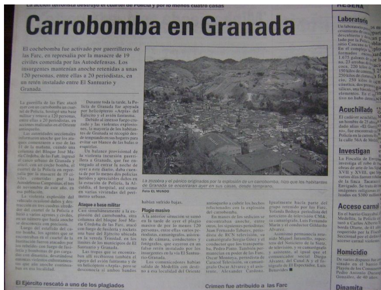
IMAGEN N.2: REDACCIÓN DE LA NOTICIA

Al observar la noticia del periódico El Mundo se evidencia que el principal mensaje a transmitir al lector es el uso del “carro bomba” de parte de las FARC. Al leer detenidamente se encuentra que el término es repetitivo; aproximadamente se menciona ocho veces el mensaje de carro bomba; aún más, en párrafos que se refieren a otra idea se retoma el mensaje principal, miremos un ejemplo: