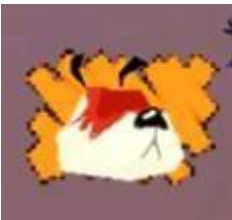
Imagen 4. Naranja: Debes estar alerta pues si te acercas te podrán ver, se sigiloso (Herve y Couppey, 2001).