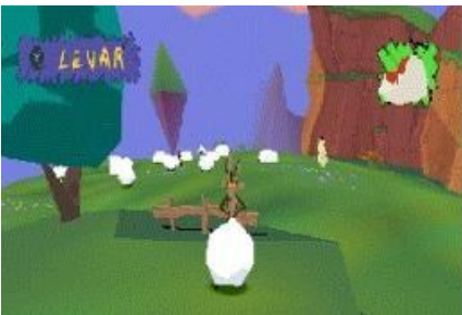
Imagen 6. Ejemplo de la tarea (Herve y Couppey, 2001).

Por otro lado, la segunda parte del análisis de tarea se denomina “nivel de análisis subjetivo”, cuyo análisis se lleva a cabo a partir del nivel de desempeños a partir del procesamiento real. Esta parte se lleva a cabo mediante dos fases: la primera consiste en especificar la demanda cognitiva de la tarea y niveles de desempeño y la segunda consiste en el análisis subjetivo del desempeño real, donde se analiza de manera concisa el desempeño del individuo con base al algoritmo ideal de la resolución de la tarea. A continuación, se presenta el ejemplo del análisis subjetivo del nivel 1 y el desempeño del participante 4.