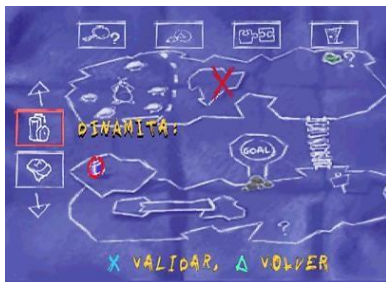
Imagen 2. mapa (Herve y Couppey, 2001).

Para iniciar la actividad de extraer, se hace necesario un mapa