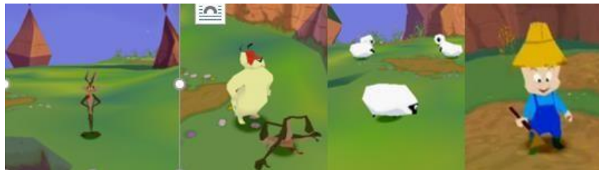
Imagen 1. Personajes (Herve y Couppey, 2001).

Para iniciar la actividad de extraer, se hace necesario un mapa