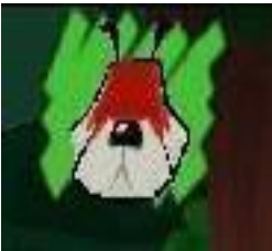
Imagen 3. Verde: Esto indica que no te pueden ver de momento (Herve y Couppey, 2001).

En conclusión, el jugador aparece frente a un grupo de ovejas al fondo y Sam vigilándolas. Este es el contexto en el cual estará inmerso el jugador y en el cual deberá idear una forma para extraer la oveja a un lugar alejado del rango de visión del perro ovejero.