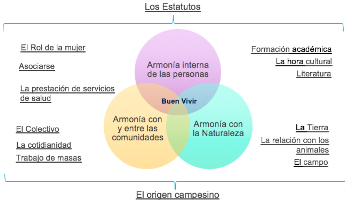
Gráfico 3: Mapa conceptual, que reúne los hallazgos con el planteamiento expuesto en el marco conceptual

En los siguientes apartados, se describirán algunos de los elementos relevantes identificados en el trabajo de campo, que se comentarán con conceptos teóricos de otras investigaciones con la intención de reflexionar sobre el dato y como la categoría descrita presenta tensiones o puntos de encuentro con la configuración del buen vivir como concepto.