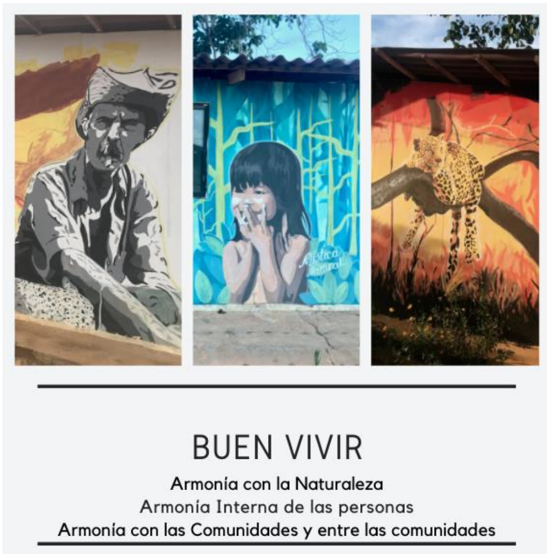
Gráfico 2: Elementos que configuran el concepto de Buen Vivir. Construcción propia

Dentro de las estrategias que ha desarrollado el gobierno ecuatoriano para incluir el concepto del buen vivir en la política que rige su constitución, ha creado una lista de dimensiones que se expresan en indicadores que permiten medir el buen vivir (27). Estos se han utilizado en el desarrollo de la presente investigación para rastrear aquellos códigos de conducta de una comunidad específica que reflejan la construcción "individual" y "colectiva" del buen vivir.