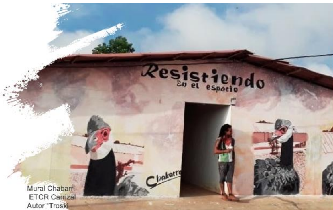
Mural Chabarrí ETCR Carrizal Autor "Troski"