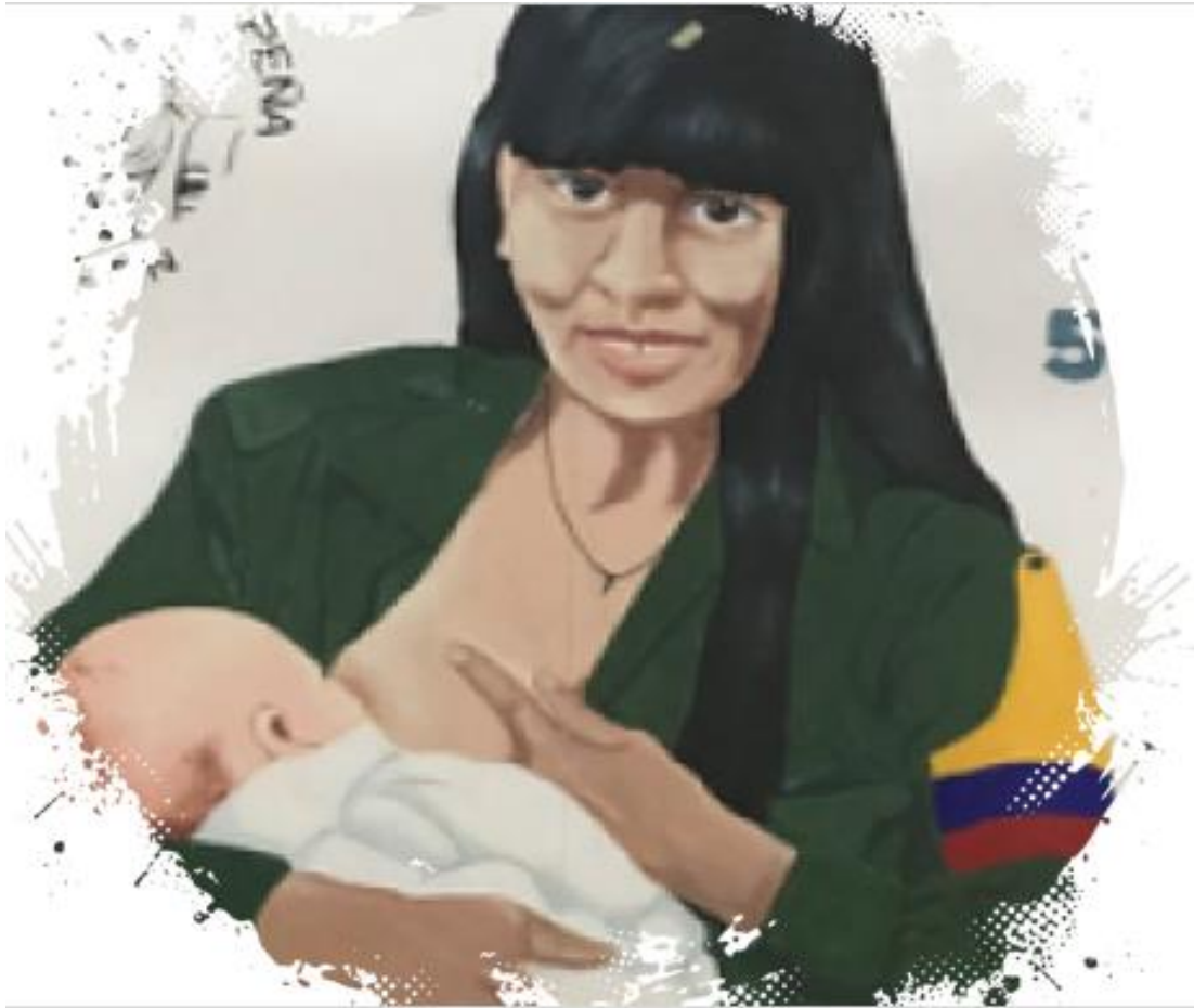
Mural: Mujer Fariana lactando ETCR La Plancha

dentro del grupo. Según él, esto determinó la forma de ver la vida y las relaciones entre unos y otros; comenta que por eso dentro del grupo no se le llama esposa, sino socia 4(Diario de campo Carrizal, Cita: 1:5)