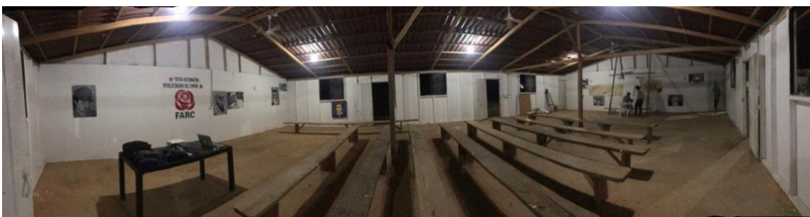
Espacio preparado para desarrollo hora cultural recargada 2.0 ETCR Carrizal 26 de enero de 2019

El grupo con el que se hizo la primera hora cultural en la última fase de la investigación (Hora cultural recargada 2.0), nos brindó un elemento enriquecedor adicional: esta vez, a diferencia de lo que sucedía en época de guerra, el encuentro no se desarrolló únicamente con farianos que viven en el espacio territorial de Carrizal, sino que además contamos con la participación de otros hombres y mujeres de la población civil que se han ido vinculando con las actividades desarrolladas en el espacio de la ETCR. Algunas han llegado allí por tener hermanos, padres o amigos en el proceso de reincorporación, pero otros simplemente son de la región y han tenido el interés de participar en estas actividades públicas, quizás motivados por algunos carteles que se hicieron y pegaron invitando a la hora cultural 2.0.