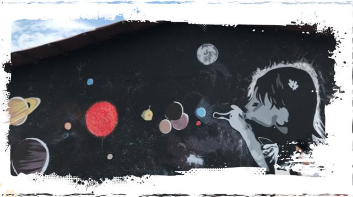
Mural colectivo ETCR Carrizal

Considero importante en este punto comenzar con la aclaración de que el buen vivir es un concepto asociado a una forma de ver y entender la vida. Durante el desarrollo de este trabajo de maestría se logró identificar elementos que se consideran aportes significativos a la consecución de ese estado en las personas con las que se desarrolló el proyecto, sin que esto corresponda exactamente a la clasificación expuesta en el marco teórico. Este, entre otras cosas, sirvió de referente importante para saber qué elementos se debían rastrear durante la investigación, pero con los cuales nunca se tuvo la intención de convertirlos en una lista de control, para determinar si cumplían o no la clasificación. Incluso en los resultados expuestos anteriormente no se hace referencia por parte de la comunidad fariana del concepto, ellos no lo denominan como buen vivir, pero esto no quiere decir que no lo sea.