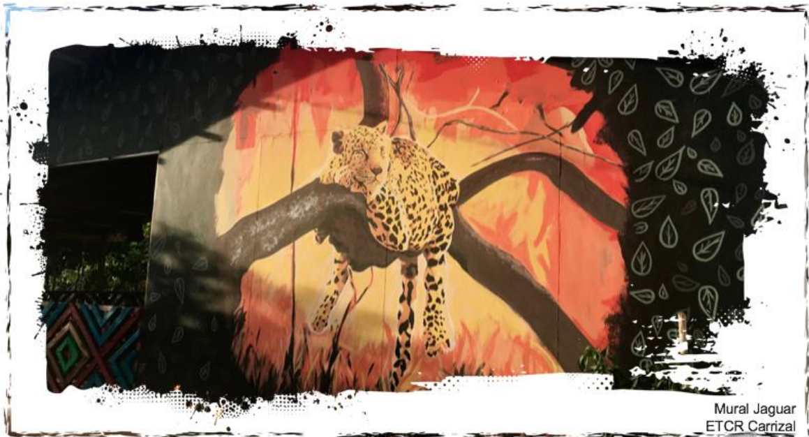
ETCR Carrizal

Durante las idas a campo y en muchas de las conversaciones que se dieron con las personas de la comunidad, resaltaba cómo se relacionaban con los animales, con elementos de protección hacia estos más marcados en algunos que en otros, pero con una línea de respeto general en la mayoría de ellos.