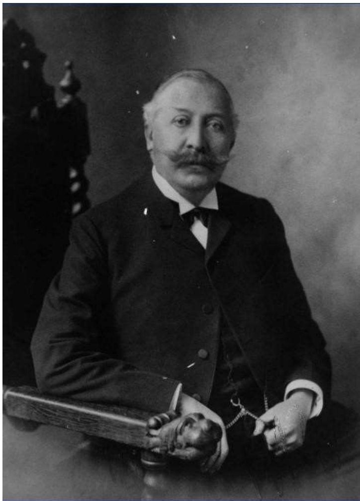
Ilustración 5. General Rafael Reyes