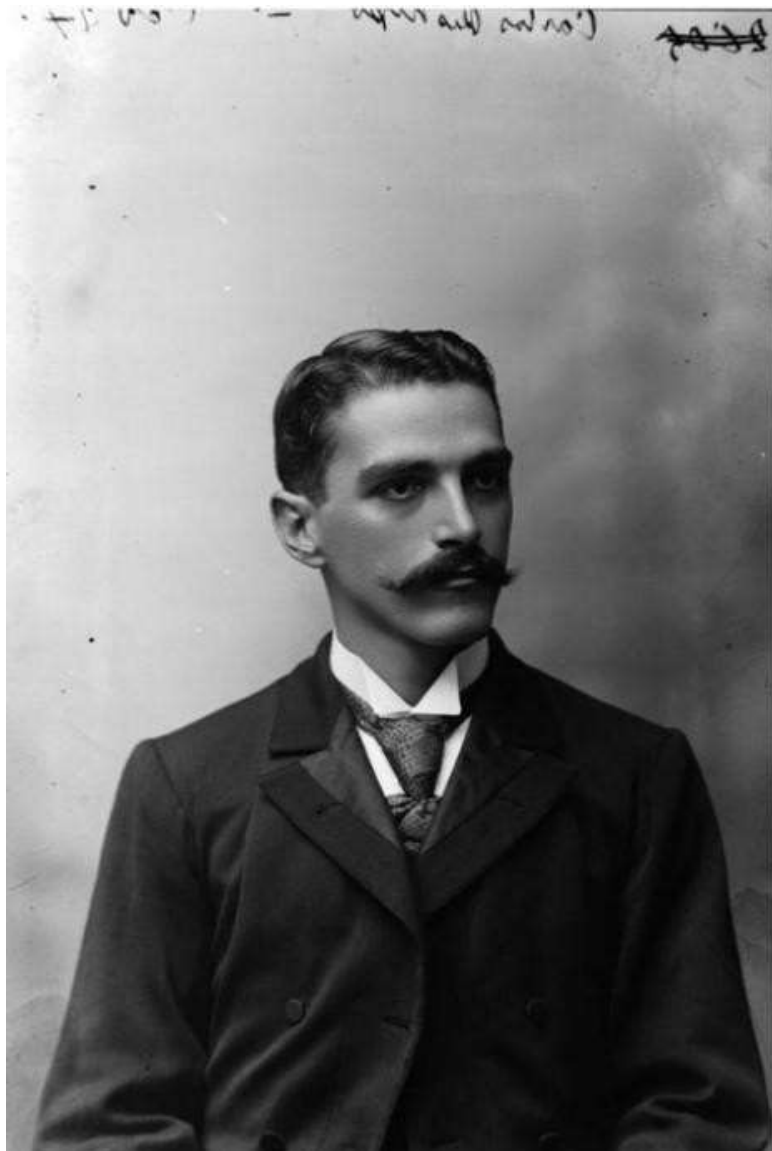
Ilustración 6. Carlos E. Restrepo

Fuente: Fotografía Rodríguez, “Carlos E. Restrepo” (13x18cm) Medellín, 1897. Archivo Fotográfico Biblioteca Pública Piloto, Medellín. BPP-F-009-0460