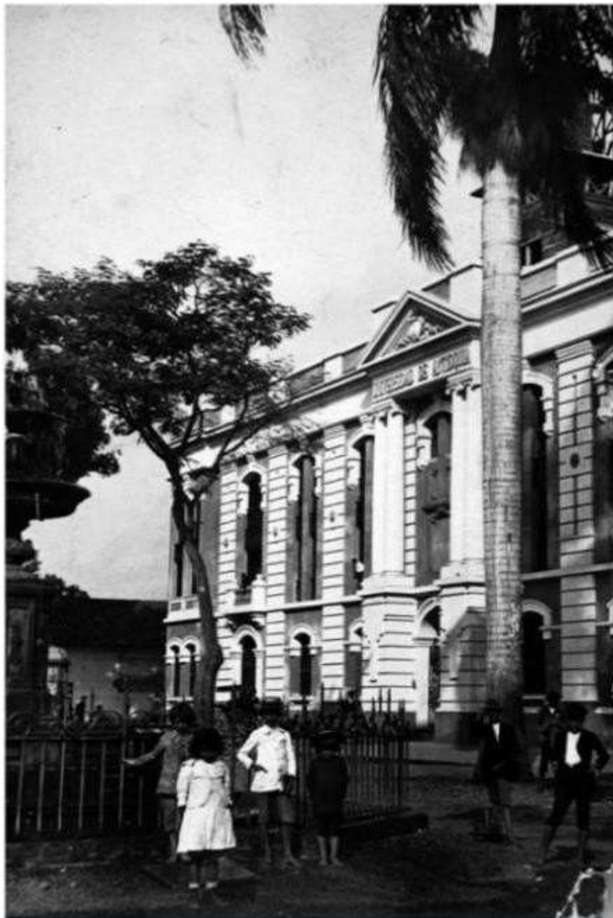
Ilustración 3. Universidad de Antioquia 1914