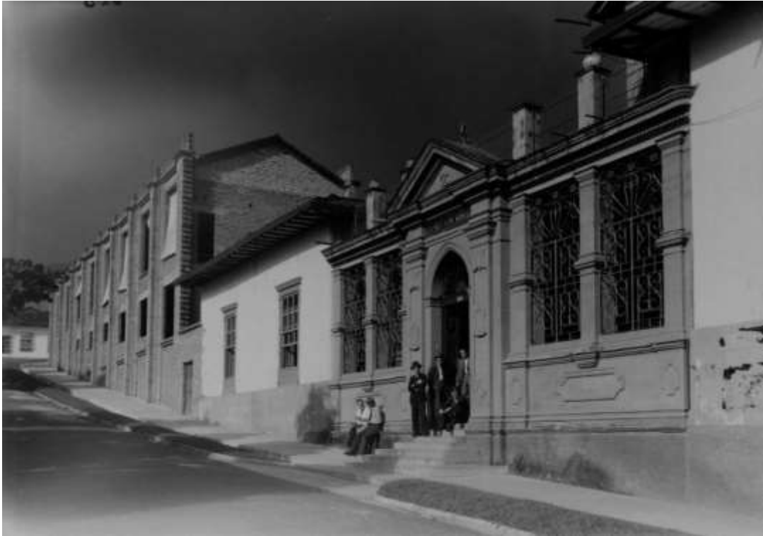
Ilustración 7. Escuela Nacional de Minas