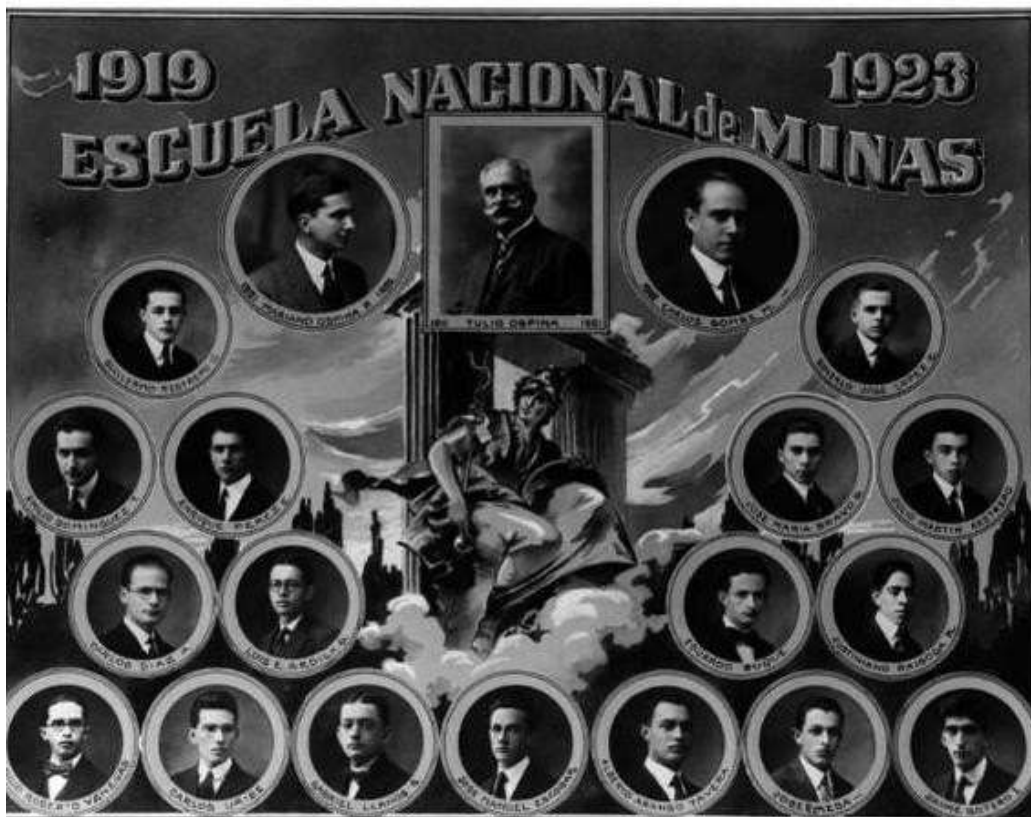
Ilustración 2. Mosaico Escuela Nacional de Minas