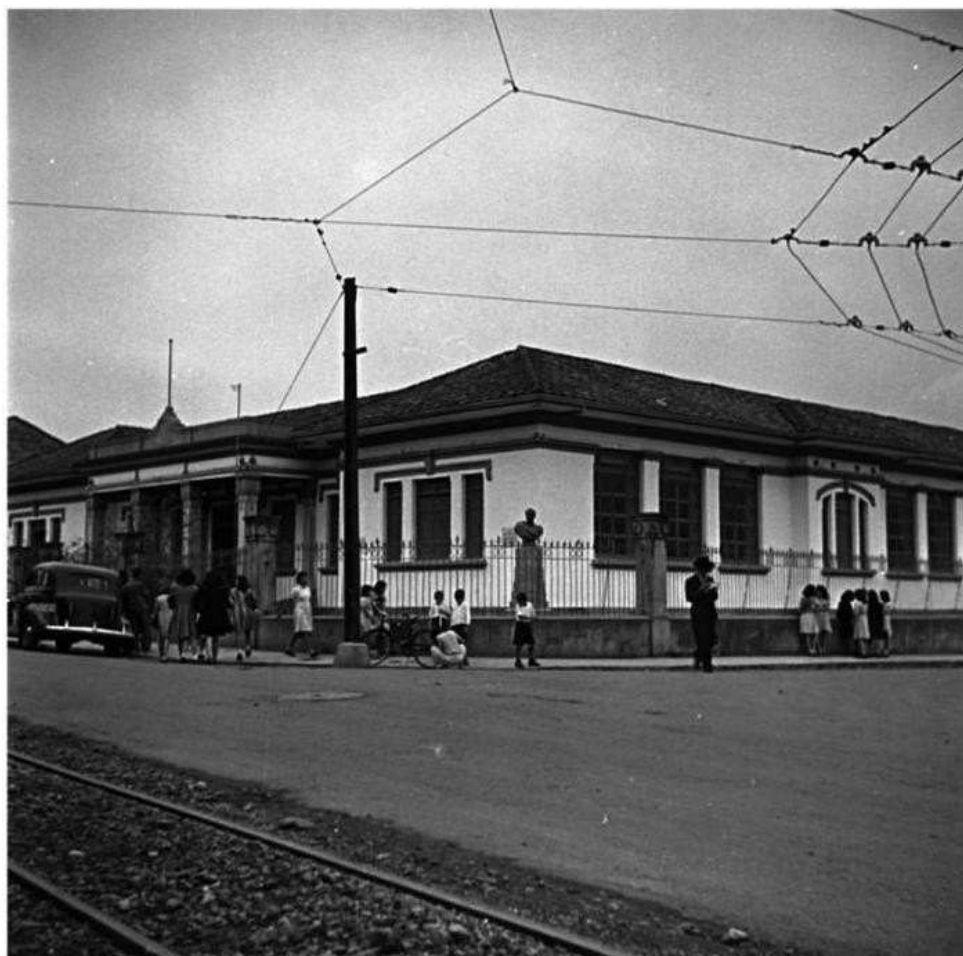
Ilustración 4. Escuela Modelo Medellín