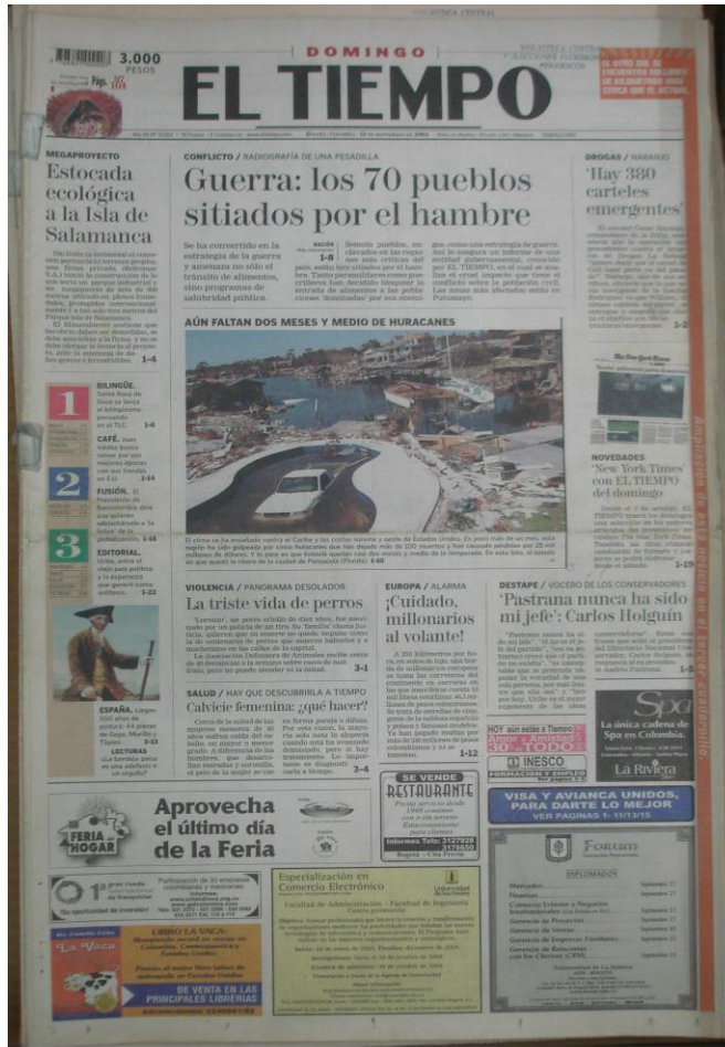
Figura 1. Fotografía sobre la nota “Exigencia frente a detenciones” (H27), en relación a la foto de portada en el periódico “El Tiempo”.