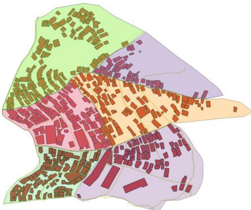
Imagen 3. Mapa de Carpinelo seccionado por zonas para asignar al censo.

El diseño de la ruta de recolección de datos se planteó inicial mente por cuadralados, pero por la indicaciones y recomendaciones que la comunidad n se percibió que el posicionamiento de las estructuras no lo permitía, ya que este barrio no cuenta con una construcción planificada lo que imposibilita la elaboración de los cuadralados, por este motivo se tomó la decisión de realizar la toma de datos por zonas como se puede observar en la siguiente imagen.