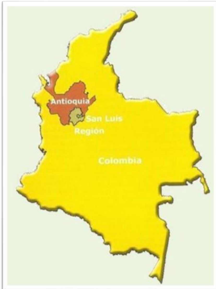
Ubicación de San Luis Colombia. Imagen tomada de: http://sanluis-antioquia.gov.co/mapas_municipio.shtml?apc=bcxx-1-&x=1498721