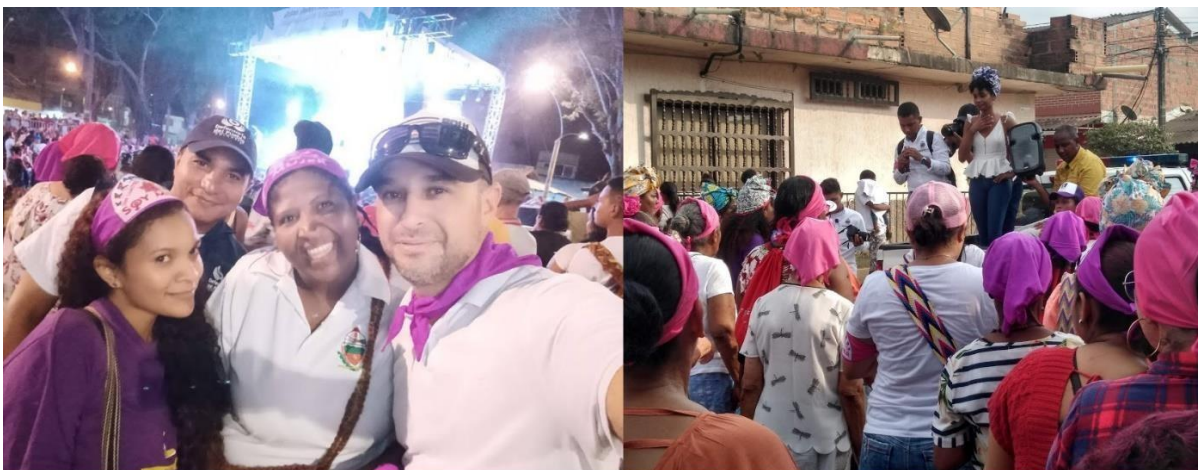
Palmera L. caminata y concierto en conmemoración del día de la mujer, estrategia de difusión ruta de atención, 8 de marzo de 2020. Fotografía.

Al finalizar la caminata se realizó un concierto organizado entre La alcaldía de Apartadó, el Programa JSP de USAID y la Red Nacional de Mujeres, la artista invita era Aida Bossa y un artista de la región. La intencionalidad de este evento era promocionar la aplicación y a la vez dar a conocer la nueva ruta de atención. CONMOVIU y Mujeres del Plantos, se involucraron activamente en todas las actividades que se realizaron para esta fecha. Durante la jornada mujeres y hombres asistentes se interesaron en la aplicación e información que se estaba dando.