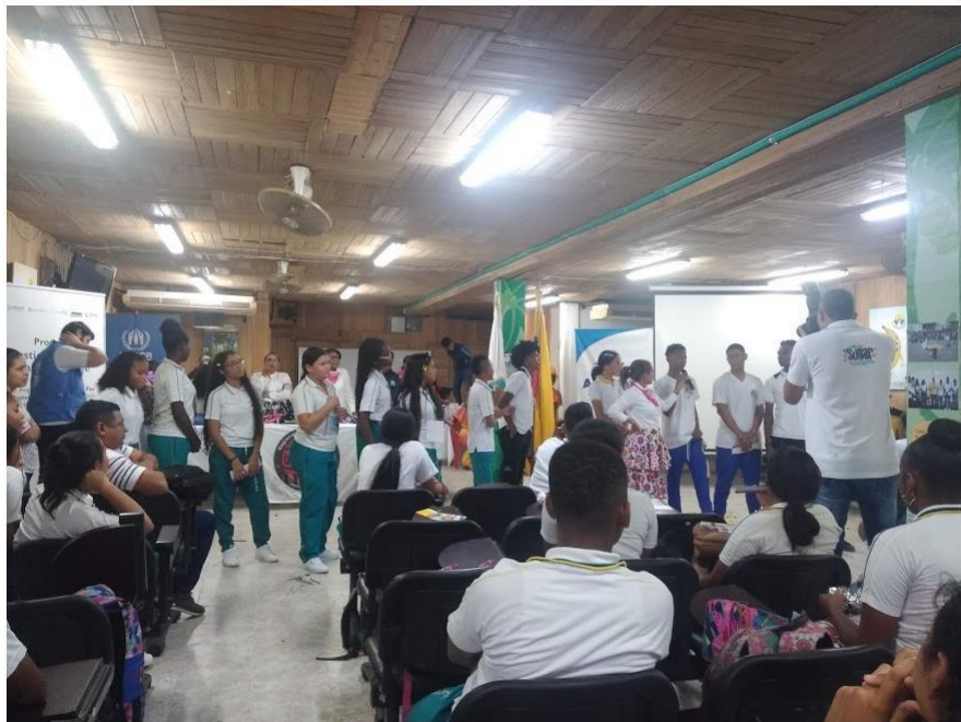
Palmera L. Foro: construyamos juntos desde la equidad, 6 de marzo de 2020. Fotografía.