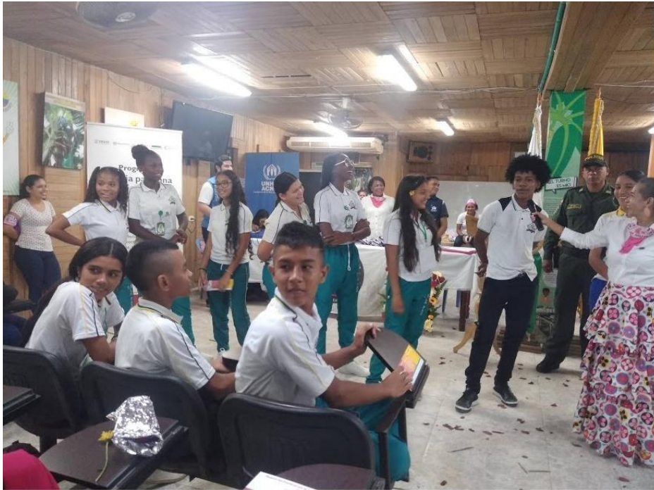
Palmera L. Foro: construyamos juntos desde la equidad, 6 de marzo de 2020. Fotografía.