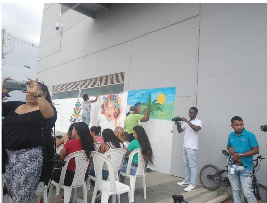
Palmera L. Pensando en la equidad de género, conmemoración día de la mujer, 11 de marzo de 2020. Fotografía.

En este encuentro las mujeres y hombres participaron, una de las preguntas recurrentes era que hacer cuando los hombres son violentados, y en torno a estas preguntas se hicieron reflexiones sobre la importancia de prevenir las violencias ejercidas hacia los hombres y las mujeres. Para lograr una equidad real, no hay que sacar del radar a los hombres, la construcción debe ser conjunta para ir rompiendo esos imaginarios. Al finalizar la jornada se hicieron muestras culturales por parte de las mujeres y uno de los hombres asistentes dedico un poema a las mujeres presentes.