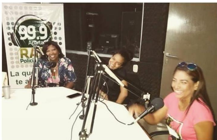
Palmera L. difusión de la ruta de atención de Violencias Basadas en Género del municipio de Apartadó, en emisoras, 2 de febrero de 2020. Fotografía.

practicante solo se me permitió participar en esta emisora, en las emisoras de la Alcaldía de Apartadó y Antena Stereo fue la coordinadora del Programa Equidad de Género quien compartió la información con los oyentes.