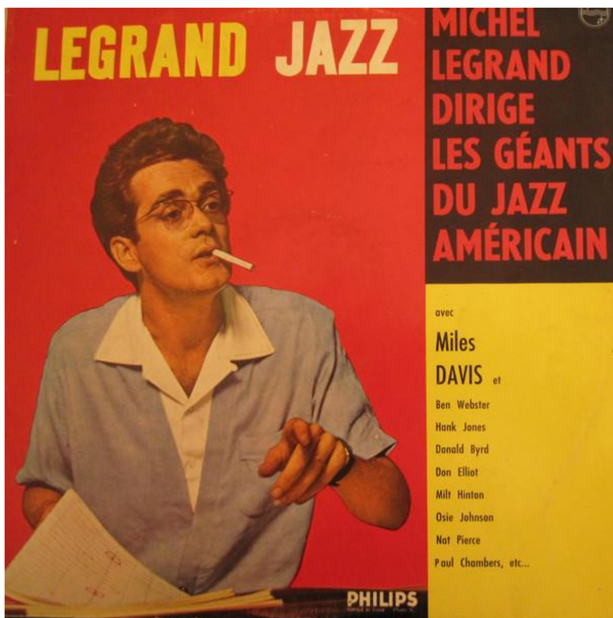
Anexo No. 4 - Carátula del disco "Legrand Jazz"