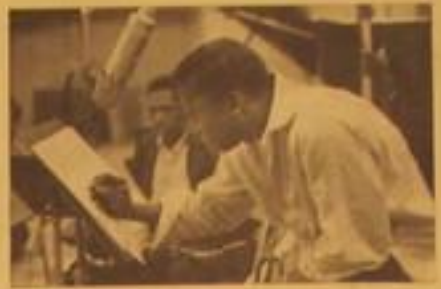
John Coltrane - John Coltrane