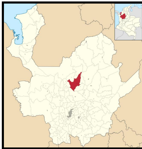
Figura 1 Yarumal en Antioquia y Colombia

Nota: Fuente https://www.yarumal.gov.co/alcaldia/mapas-de-yarumal