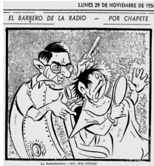
Figura 8. El barbero de la radio

Nota. Fuente Chapete, “El barbero de la radio” El Tiempo (Bogotá) 29 de noviembre de 1954: 4