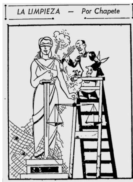
Figura 2. La limpieza

Nota.