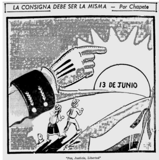
Figura 4. La consigna debe ser la misma

Nota. Fuente: Chapete, “La consigna debe ser la misma” El Tiempo (Bogotá) 13 de junio de 1954: 4