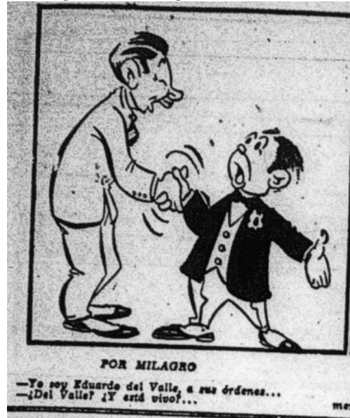
Figura 15. De domingo a domingo, Por milagro

Nota. Fuente: Chapete, “De domingo a domingo, Por milagro” El Tiempo (Bogotá) 24 de julio de 1954: 11