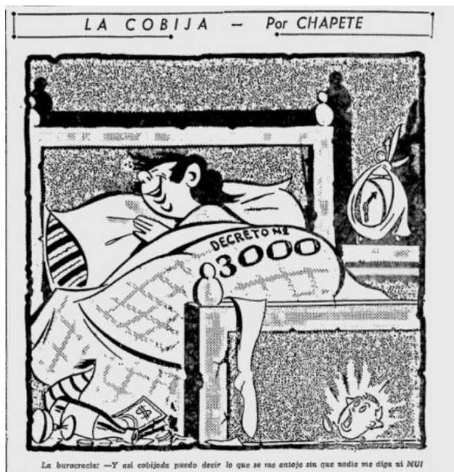
Figura 9. La cobija

Nota. Fuente: Chapete, “La cobija” El Tiempo (Bogotá) 21 de octubre de 1954: 4