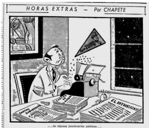
Figura 3. Horas extras

Nota. Fuente: Chapete, “Horas extras” El Tiempo (Bogotá) 5 de abril de 1954: 4