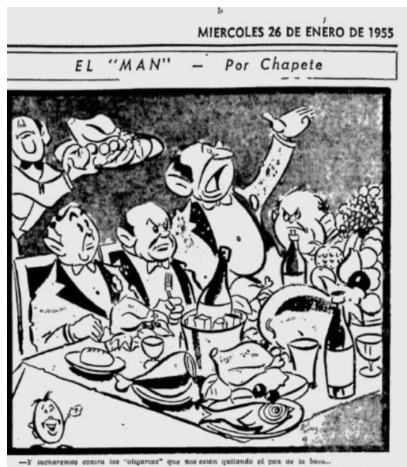
Figura 10. El MAN

Nota. Fuente: Chapete, “El MAN” El Tiempo (Bogotá) 26 de enero de 1955: 4