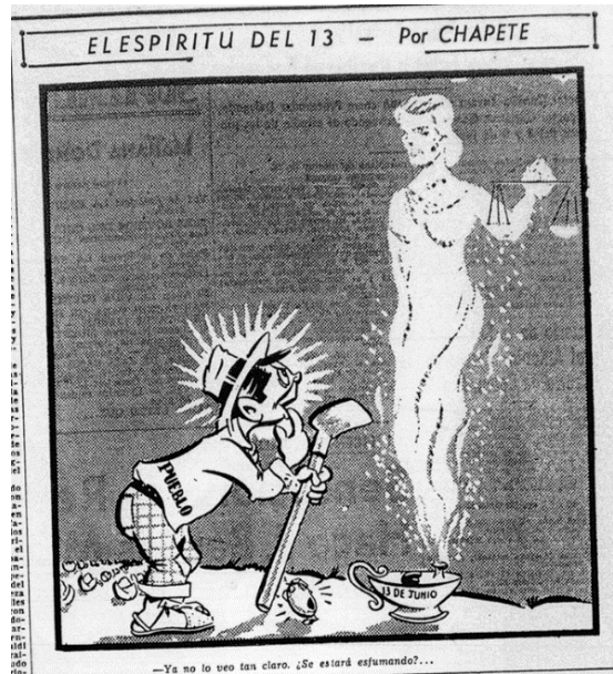
Figura 5. El espíritu del 13

Nota. Fuente: Chapete, “El espíritu del 13” El Tiempo (Bogotá) 6 de agosto de 1954: 4