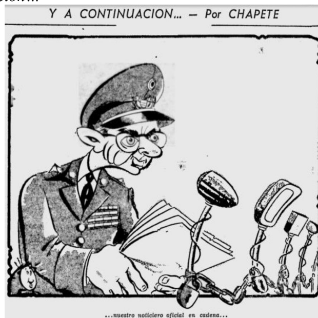
Figura 11. Y a continuación...

Nota. Fuente: Chapete, “Y a continuación...” El Tiempo (Bogotá) 2 de marzo de 1955: 4