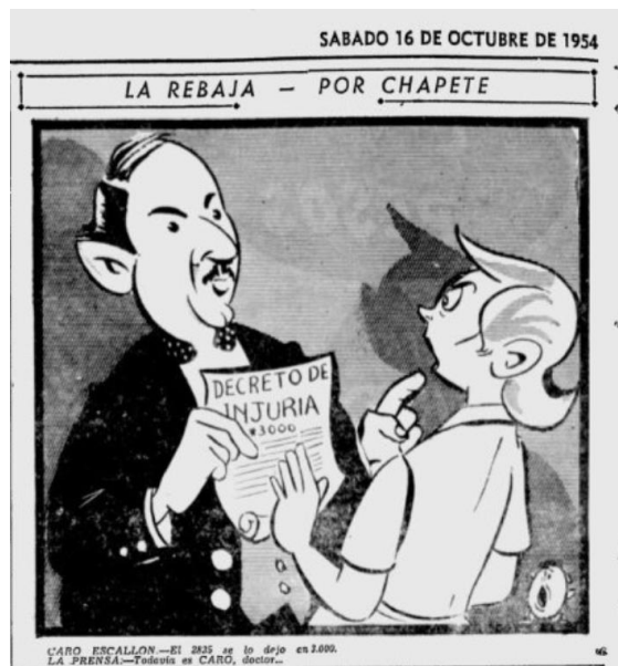
Figura 7. La rebaja

Nota. Fuente: Chapete, “La rebaja” El Tiempo (Bogotá) 16 de octubre de 1954: 4