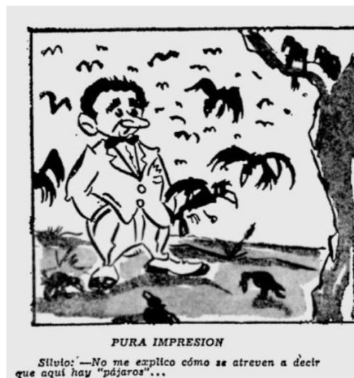
Figura 13. Pura impresión

Nota. Fuente: Chapete, “De domingo a domingo, Pura impresión” El Tiempo (Bogotá) 17 de julio de 1955: 11