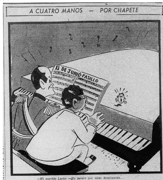
Figura 6. A cuatro manos

Nota. Fuente Chapete, “A cuatro manos” El Tiempo (Bogotá) 6 de octubre de 1954: 4