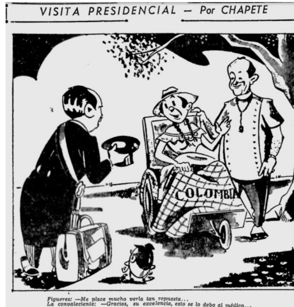
Figura 1. Visita presidencial

Nota. Fuente: Chapete, “Visita presidencial” El Tiempo (Bogotá) 8 de octubre de 1953: 4