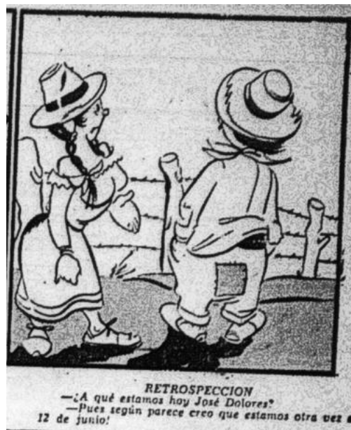
Figura 16. De domingo a domingo, Retrospección

Nota. Fuente: Chapete, “De domingo a domingo, Retrospección” El Tiempo (Bogotá) 24 de julio de 1954: 11