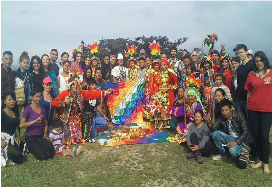
Figura 9 Inti Raymi