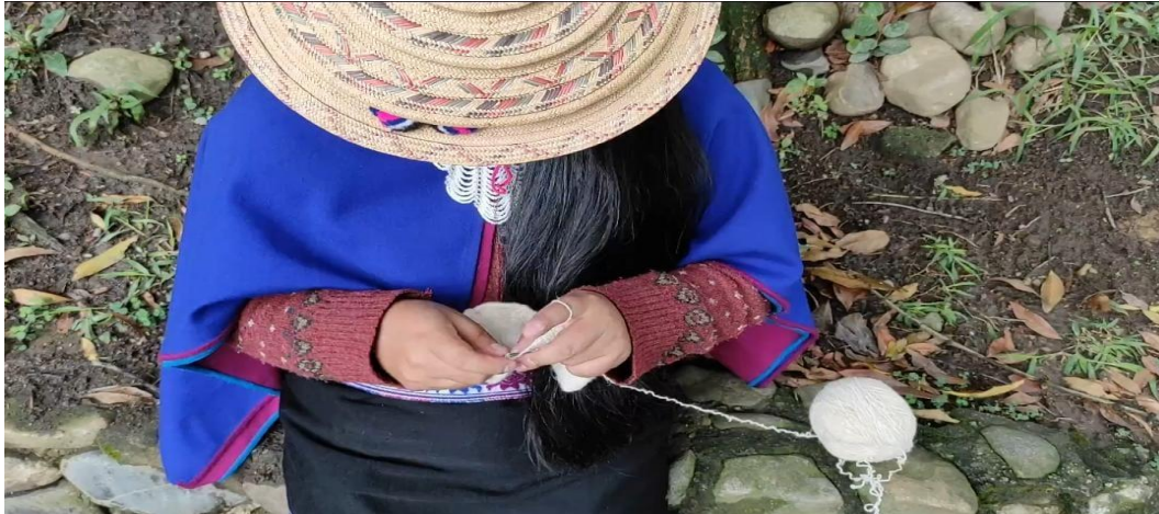
Figura 2 Tejido en espiral

Nota. Fuente: tomada de (Tunubala, 2020). Tejido en forma de espiral es como la cosmovisión Misak dice que se camina partiendo desde un punto que sería el fogón, el territorio y se va desarrollando