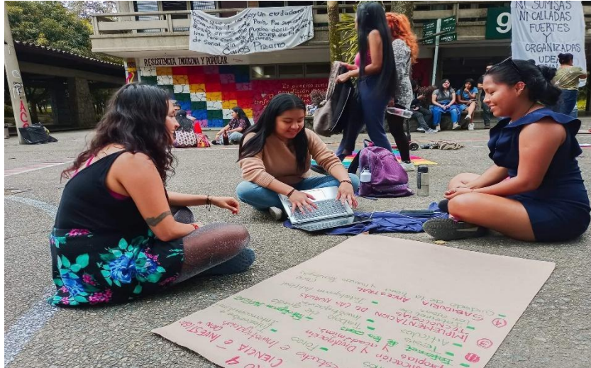
Figura 10 Juntanza