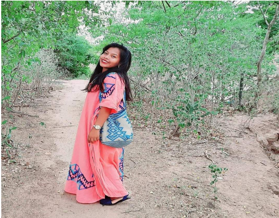
Figura 14 Viaje a la raíz

Nota. Fuente: Mujer indígena estudiante wayuu en su territorio de origen en la Guajira. (Epinayu, 2020)