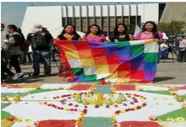
Figura 8 Celebración día de las lenguas Nativas

Nota. Fuente. Tomado de (Puerchambud, 2019)