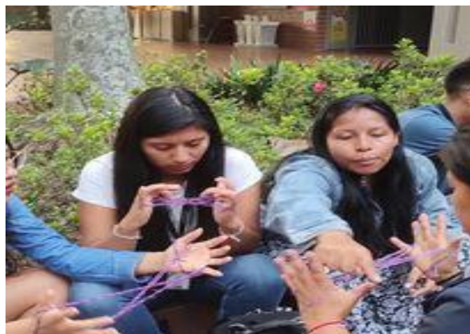
Figura 11 Tejedoras

En el cabildo indígena universitario participa activamente un aproximado de unas 100 mujeres de diferentes pueblos originarios y que a su vez conforman otros colectivos ya sea de danza o emprendimientos. Estos datos según registros del cabildo en las mingas y asambleas a lo largo de su proceso han tenido alrededor de 5 mujeres que han ocupado el cargo de gobernadoras pertenecientes al pueblo Nasa, Embera, Inga, Misak, Kametsa, lo cual ha sido de gran incidencia y motivación para fortalecer el liderazgo y aunque no ha sido fácil, son caminos que dejan huellas.