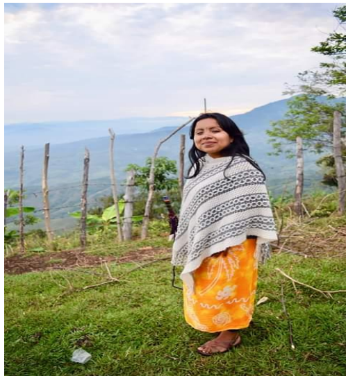
Figura 12 Liderazgos