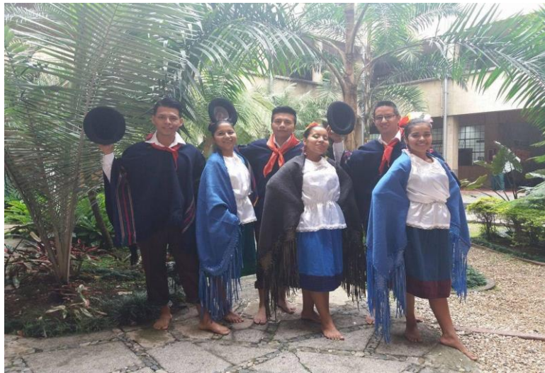
Figura 7 Grupo de danzas

Nota. Fuente: Archivo fotográfico, Grupo de danza pasos que dejan huella