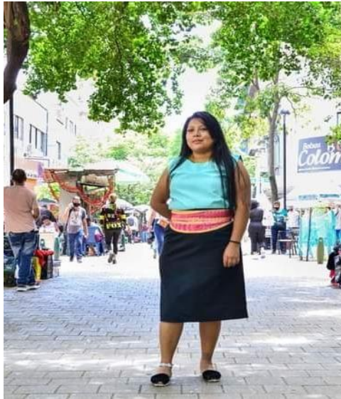
Figura 13 Empoderamiento

Nota. Fuente: Representante Inga del Consejo Municipal de Juventud indígena Medellín (2022)