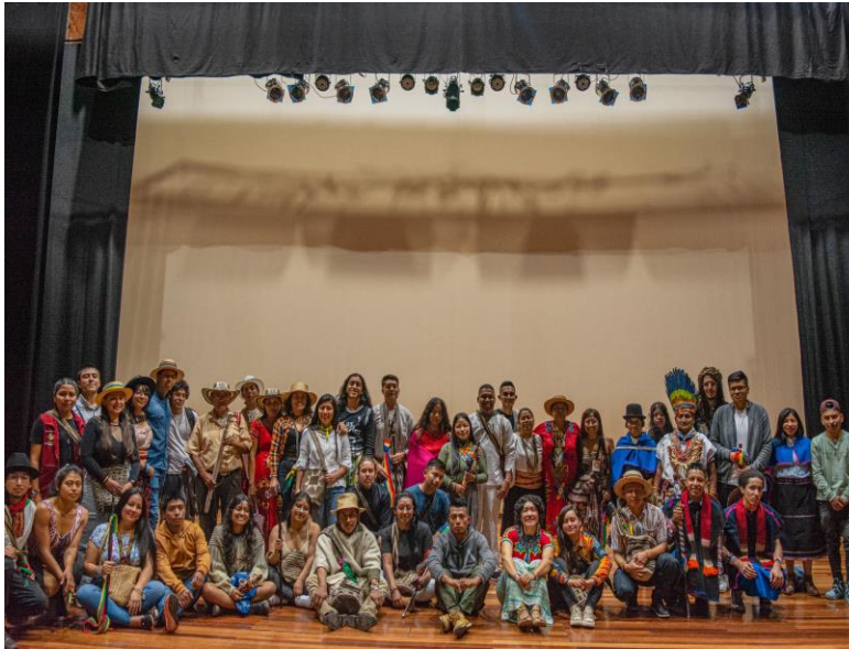
Posesión junta directiva CIUM

Nota. Fuente. Participación de indígenas estudiantes y autoridades de territorio en el Teatro Camilo Torres de la Universidad de Antioquia. Tomado de (Cabildo indígena universitario [imagen], 2023)