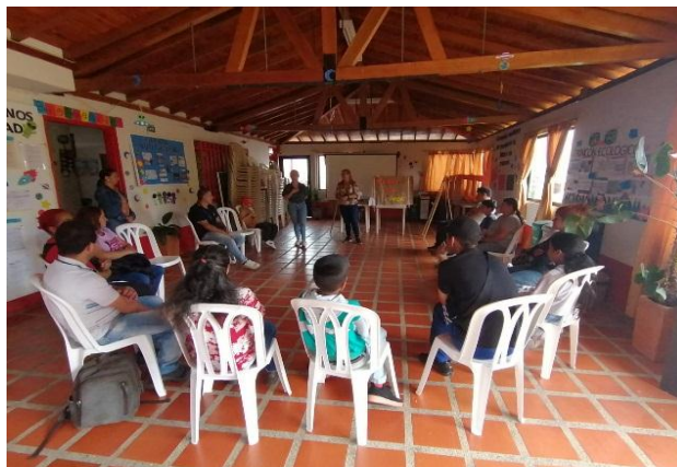
Figura 8 El tendedero de “acciones con amor”

Seguidamente, se les hace entrega de una hoja donde escribieron sus reflexiones o ideas sobre las acciones que van a realizar en su familia para fomentar una sana convivencia desde el amor y el respeto