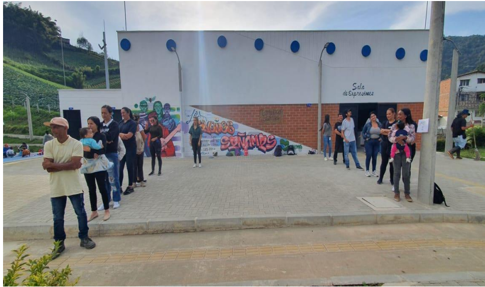
Actividad “El teléfono roto y la mímica”

Para la segunda actividad del taller, enfocado a la resolución de conflictos se propone dividirse en subgrupos para “darle la vuelta a la sabana”, se propone que escriban la estrategia que utilizaron para poder desarrollar satisfactoriamente el ejercicio, o de lo contrario un aspecto a mejorar para resolver la situación planteada. El objetivo de ponerle las velas al barco es abrir un espacio de conversación y reflexión sobre los aspectos que se debe de tener en cuenta para gestionar un conflicto a partir de la comunicación asertiva.