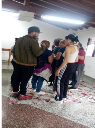
Actividad “Darle vuelta a la sabana”