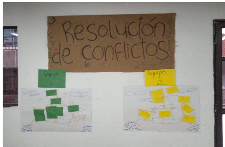
Mural de situaciones – “El barco”

Orientar a las familias frente a la gestión de conflictos es crucial porque permite establecer un ambiente armonioso y respetuoso en el hogar. Para esta temática, se concluye de manera grupal que la gestión de conflictos en la familia promueve la escucha activa, el entendimiento mutuo y la búsqueda de soluciones que beneficien a todos los miembros.