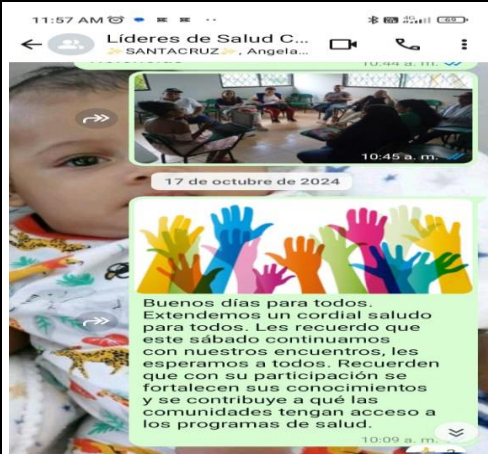
Interacción grupo whatsapp