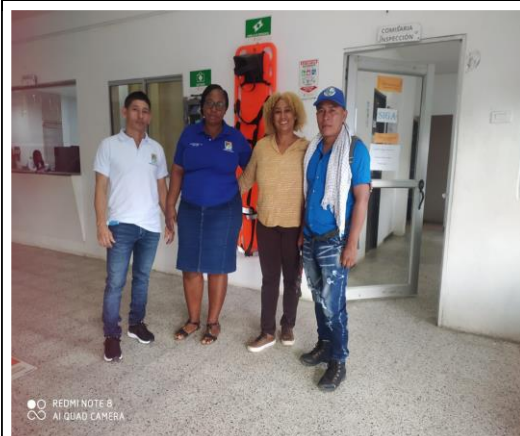
articulación con líder de comunidad indígena