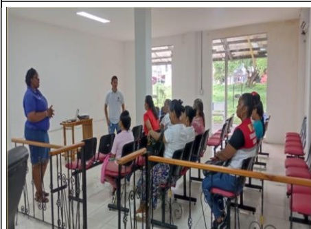
Reunión con líderes de salud de las diferentes JAC