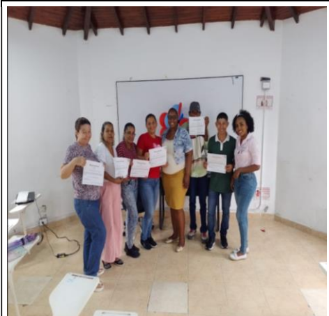
Taller N°4: asumo mi rol dentro del sistema de salud en mi territorio y contribuyo al mejoramiento de los programas de salud