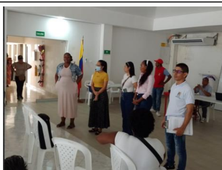
Articulación con líderes de Juntas de acción comunal