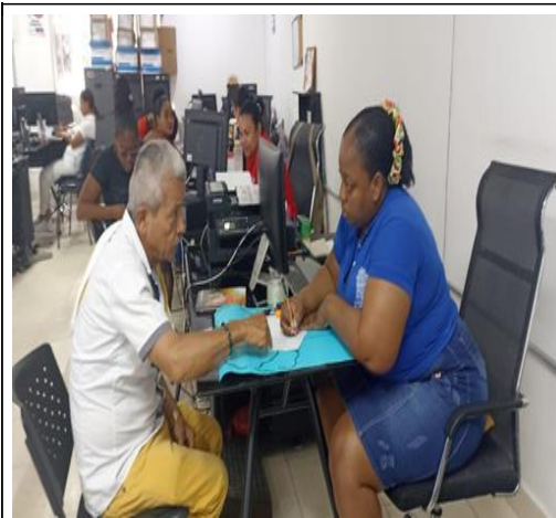
Representante comité de discapacidad Municipal