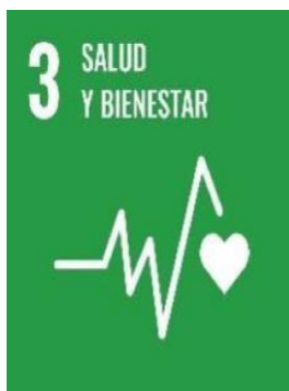
Figura 2 Salud y bienestar

Este objetivo busca “Garantizar una vida sana y promover el bienestar para todos en todas las edades” (PNUD, 2019). Mediante el proceso de formación y capacitación se fortalecerá el conocimiento sobre el sistema de salud que tienen los diferentes actores que participan del proyecto, generando de esta manera que sus comunidades mejoren el acceso a los servicios de salud.