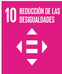
Figura 3 Reducción de desigualdades