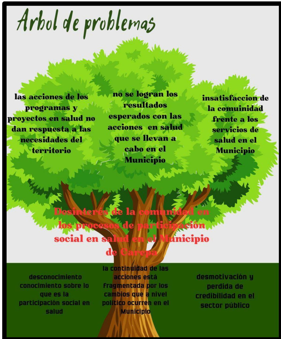
Figura 5 Árbol de problemas