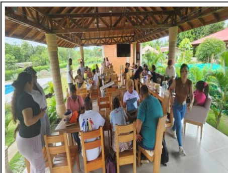
Apoyo en la socialización de la política de participación con funcionarios de la DLS