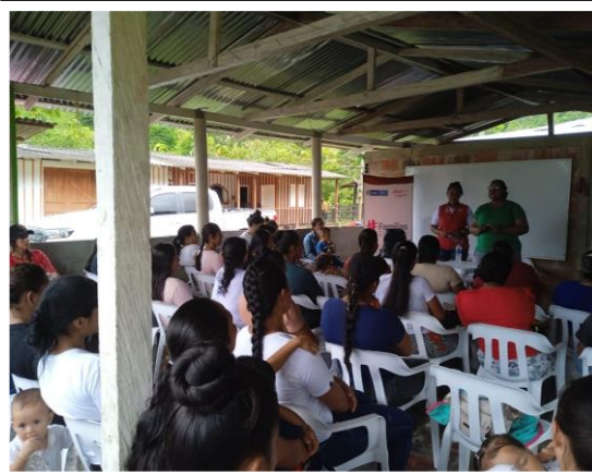
articulación con madres líderes rurales del programa renta ciudadana