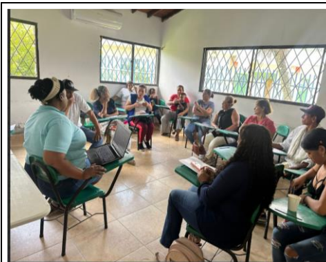
Taller N°2: Conozco la política de participación social e identifico en qué espacio puedo tener voz y voto