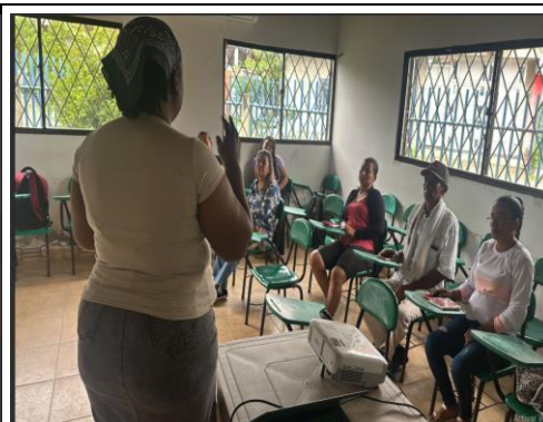
Taller N°3: Yo tomo la voz por mi comunidad y represento sus necesidades en salud