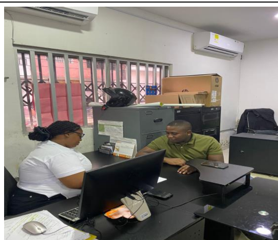
Representante Población Afro