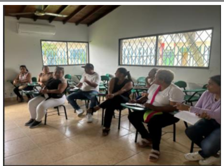
Taller #1 Qué tanto conozco del sistema de salud