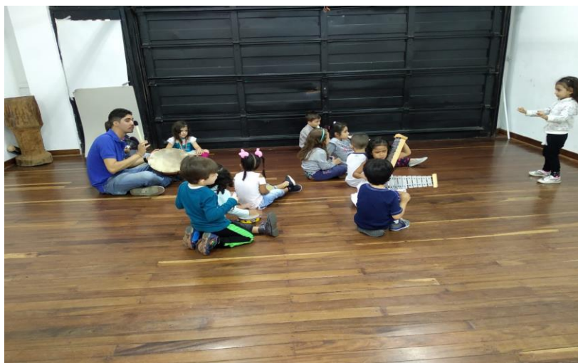
Ilustración 1 Experiencia 1

Esta actividad se desarrolló en el mes de mayo de 2019 con un grupo de estudiantes de la Institución Educativa Primitivo Leal la Doctora, en un espacio brindado por la casa de la cultura la Barquereña gracias a un convenio interinstitucional. La actividad está enfocada en vivenciar los elementos del ritmo trabajando los conceptos de pulso, acento, tempo y dinámicas de intensidad, llevando a los estudiantes que vivencian a través de su cuerpo una experiencia rítmica.