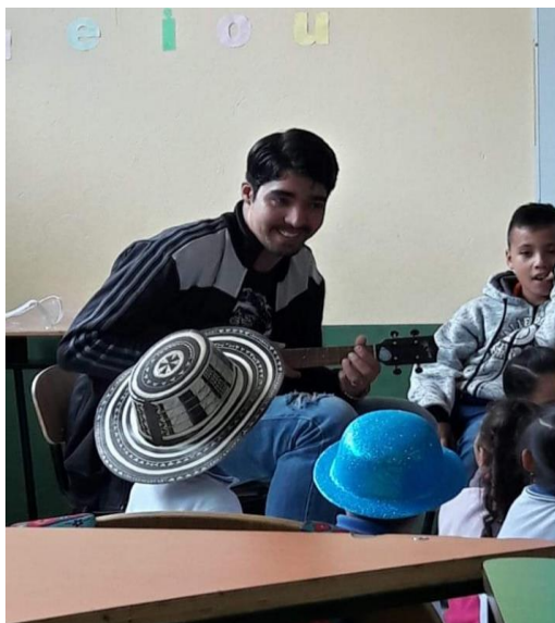
Ilustración 3 Experiencia 3 fuente Autoría propia

Con un grupo de estudiantes del grado tercero de la Institución Educativa Primitivo Leal la Doctora se desarrolló una actividad enfocada en vivenciar los elementos de la música enseñando a través de canciones de ronda como la escala de Do mayor, canción del ritmo y