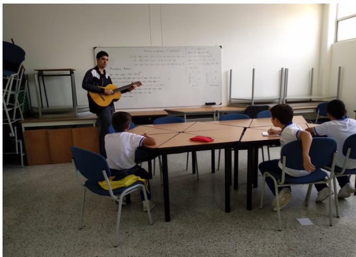
Ilustración 2 Experiencia 2

Esta actividad se desarrolló en el mes de marzo de 2019 con un grupo de estudiantes de la Institución Educativa Primitivo Leal la Doctora, en un espacio brindado por la Institución Educativa Primitivo Leal La Doctora. La actividad está enfocada en vivenciar los elementos de la melodía enseñando a través de la escucha y el canto el concepto de melodía, además se interpretan pequeñas canciones en la guitarra para así mostrar las diversas maneras