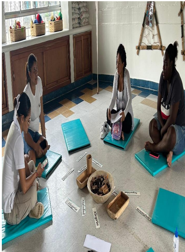
Segundo encuentro del semillero de emprendimiento.