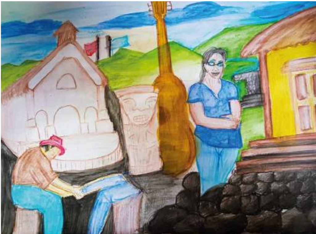
Historia del vientre