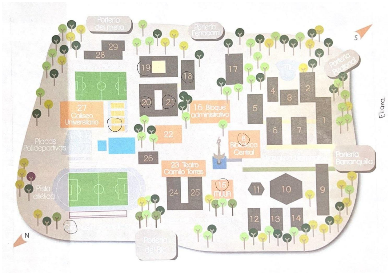
Figura 4 Cartografía de P4