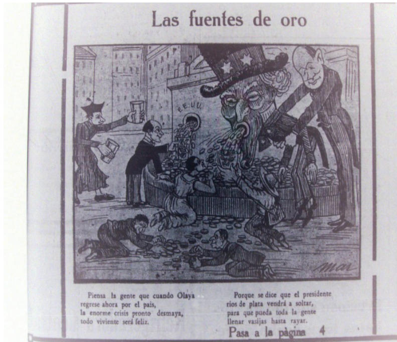
Figura 6. "Las fuentes de oro"

Fuente: Del Río, Miguel Ángel (Mar). 1930f. "Las fuentes de oro". El Bateo , Junio 5, p. 1.