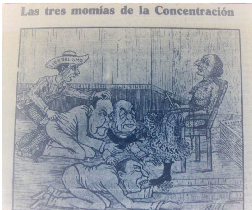
Figura 4. “Las tres momias de la Concentración”