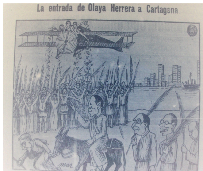
Figura 1. “La entrada de Olaya Herrera a Cartagena”