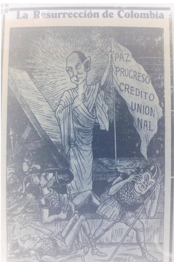
Figura 2. "La resurrección de Colombia"