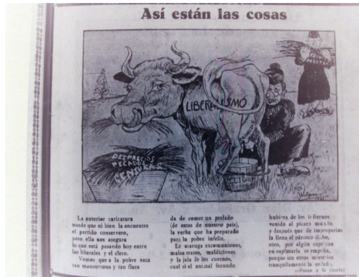
Figura 7. "Así están las cosas"

Fuente: Del Río, Miguel Ángel (Mar). 1931a. "Así están las cosas". El Bateo , Abril 23, p. 1.